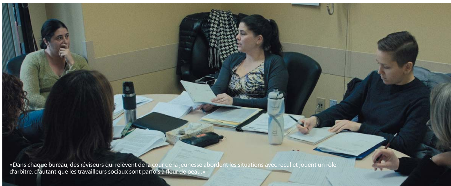
« Dans chaque bureau, des réviseurs qui relèvent de la cour de la jeunesse abordent les situations avec recul et jouent un rôle d'arbitre, d'autant que les travailleurs sociaux sont parfois à fleur de peau. »

J'aime l'idée de faire un film qui n'est pas formaté. Aucune télé ne diffuse un documentaire de deux heures sans narration, alors heureusement, il y a les festivals et les salles. Quand on voit un film sur grand écran, on est absorbé. À sa sortie en salle, Secondaire V avait suscité beaucoup de discussions. Les uns trouvaient notre système d'éducation