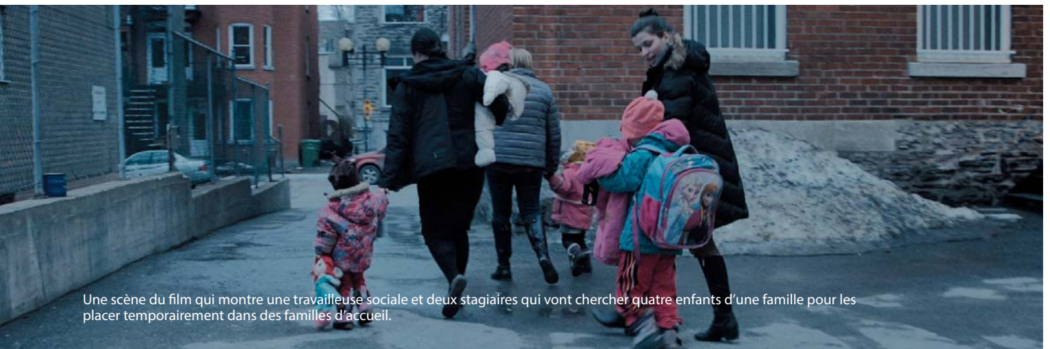
Une scène du film qui montre une travailleuse sociale et deux stagiaires qui vont chercher quatre enfants d'une famille pour les placer temporairement dans des familles d'accueil.