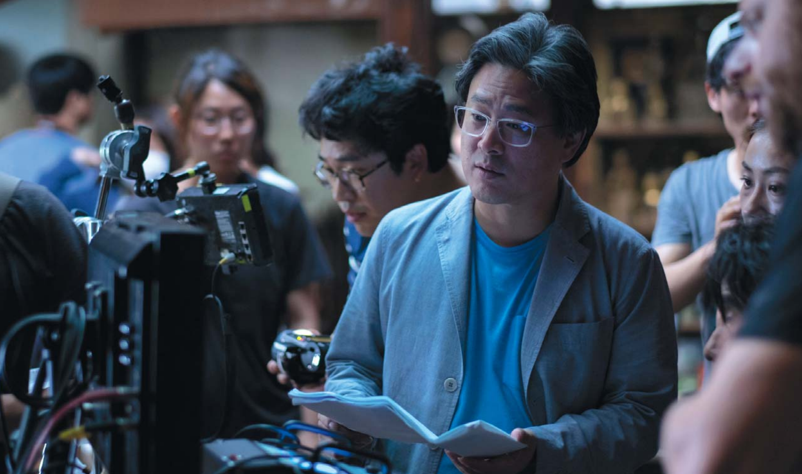
Le réalisateur Park Chan-wook lors du tournage

retrouvailles et la fuite réussie des deux femmes; par exemple, l'incendie à la faveur duquel Sookee s'évade de sa prison paraît un peu trop providentiel, presque un deus ex machina qu'elles auraient imaginé... Pendant ce temps, l'oncle Kouzuki retrouve le « comte » et lui fait chèrement payer le ravissement de sa nièce, on vous laisse imaginer ou découvrir comment. Mais bien que les mutilations soient, comme à l'habitude, pénibles (quoiqu'étrangement drôles), c'est quand même là que le film et son auteur semblent rouler sur le pilote automatique.