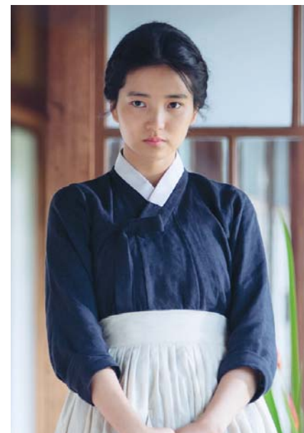
L'oncle Kouzuki, le « comte » Fujiwara, Dame Hideeko et la « servante » Sookee

d'abord, qui est celui de ses personnages principaux, en butte avec les codes répressifs de la société (l'une des questions de Fingersmith pourrait être: comment être femme et homosexuelle dans l'Angleterre victorienne, et parvenir à la liberté?), mais « genre » aussi au sens de système de codes narratifs (roman policier, de suspense ou gothique, roman à tiroirs, roman historique, dickensien, etc.), que la romancière manipule en douceur (le souci d'une histoire bien menée, qui tient en haleine jusqu'au bout) pour y injecter ses thèmes et préoccupations. Pas question, ici, de se livrer aux entreprises de démolition ou de déconstruction qui sont l'équivalent littéraire des films de Godard: c'est en narratrice consommée et assez classique que Sarah Waters raconte comment (dans Fingersmith , en tout cas) ses héroïnes conquièrent leur indépendance en se dépêtrant des conventions, des complots, des jeux de dupes et autres infortunes qui travaillent contre elles.