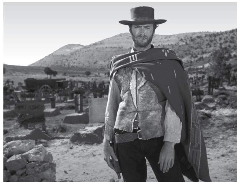
Clint Eastwood dans Le Bon, la Brute et le Truand