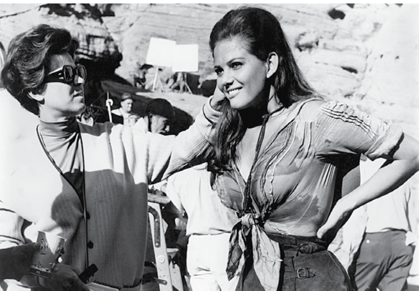
Claudia Cardinale sur le tournage de Il était une fois dans l'Ouest