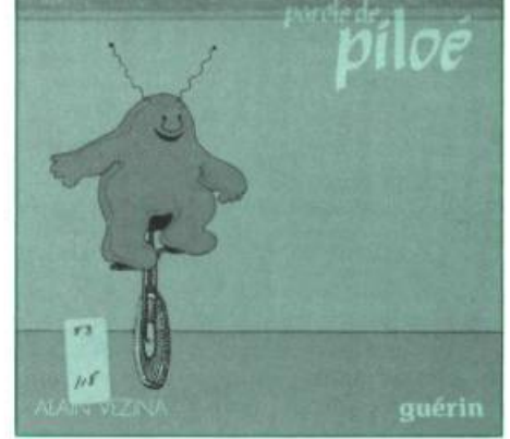
Parole de Piloé

De façon générale, il semble que la collection Textes et Contextes a d'abord cherché à offrir des textes complets alors que la collection Parcours a plutôt opté pour un plus grand nombre d'extraits. Dans les deux cas, on touche les limites de tout matériel didactique. D'une part, la formule du roman adapté réduit la variété des textes présentés aux élèves et ne les incite d'ailleurs pas à aller lire le livre. D'autre part, le recours aux extraits permet difficilement une situation de lecture naturelle et ne développe pas l'habileté à lire des textes complets de plus en plus longs.