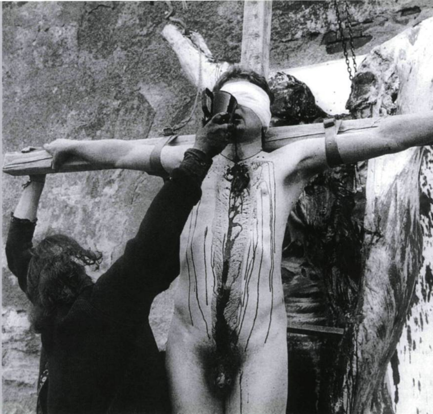
Hermann Nitsch, scène extraite d'une représentation de l'Orgien-Mysterien-Theater, 50 e action, 1975. Prinzendorf, Autriche.

A.-L. P. À LIRE LA PLUPART DE VOS OUVRAGES, LA SCULPTURE SEMBLE ÊTRE LE MODE D'ART PAR EXCELLENCE. C'EST DANS LA SCULPTURE QUE L'ART ET LA VIE SE REJOignent, QUE L'ÉTHIQUE S'ASSOCIE À L'ESTHÉTIQUE. CELA, BIEN SÛR, PRÉSUPPOSE UNE VISION DE LA SCULPTURE. POURRIEZ-VOUS EN DONNER LES GRANDES LIGNES ?