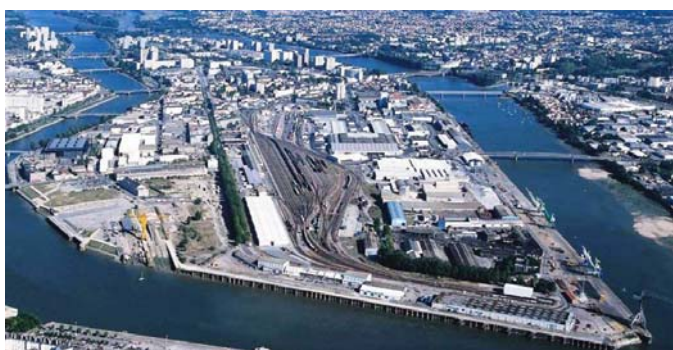
Figure 1. Photo aérienne de l'île de Nantes. Anciens chantiers navals et friches de l'entreprise Alstom sont localisés au premier plan.

Métropole. Pourtant un courrier rédigé par Ronan Dantec (Vice-Président de la Communauté Urbaine de Nantes, chargé de l'Agenda 21) en date du 29 août 2001 et destiné à Jean-Marc Ayrault (Député Maire de la ville de Nantes, Président de la communauté urbaine) développe très clairement l'éco-quartier en évoquant le projet de l'Île de Nantes : « Le projet politique que nous avons proposé aux électeurs en mars dernier [2001] évoquait l'aménagement de l'Île de Nantes sous l'angle d'un « éco-quartier ». Au-delà de l'ambition du mot, il convient dorénavant de donner du contenu concret à cette idée. (...) L'ambition d'un éco-quartier (pour l'Île de Nantes) n'est pas seulement de décliner localement les principes de l'Agenda 21 (de la ville de Nantes), il porte aussi une image forte pour Nantes à l'échelle européenne. (...) Notre volonté affirmée d'un quartier « vitrine » du développement durable peut ainsi convaincre des groupes privés d'y mener des réalisations exemplaires, notamment pour le bâti ».