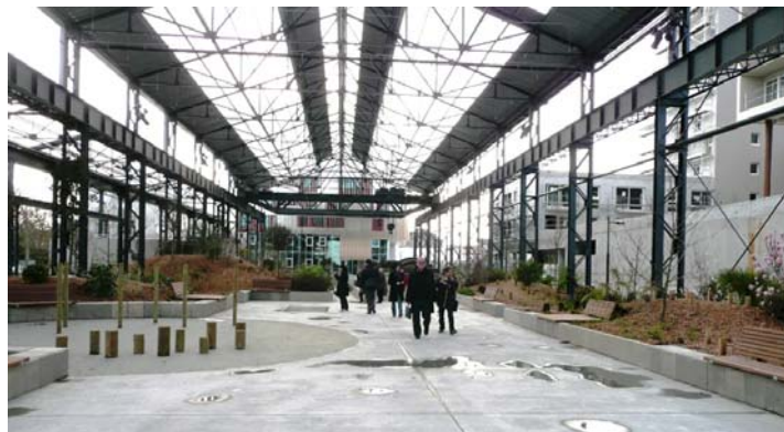
Figure 5. A l'Est de l'île, l'éco-jardin des Fonderies livré en mai 2009 sous une halle industrielle construite en 1937 (en activité jusqu'en 2001). 60 % de la surface a été recouverte d'une toiture transparente en polycarbonate cristal et les anciens fours ont été réhabilités. Le jardin est autonome en énergie : récupération des eaux de pluie pour l'arrosage et système de pompe alimenté par production solaire (maîtrise d'œuvre : atelier Doazan-Hirschberger – Bordeaux et financement REVIT).