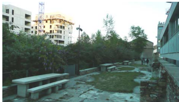
Figure 2. Recycler les traces : le square de l'île Mabon, une friche végétale valorisée entourée par de nouveaux programmes résidentiels. Photo : Barthel, mars 2009.

sommaire de bancs et tables de pique-nique. De nouvelles séquences dédiées aux modes doux ont ensuite été ouvertes sur les quais de la Loire entre 2005 et 2009 (Quais F. Mitterrand et Blancho et secteur Ouest des chantiers) avec l'aménagement de promenades sur berge ou sur les estacades, de passerelles et autres belvédères de contemplation. Une mosaïque de jardins, dont celui dit de l'Estuaire au niveau des anciennes cales (référence au Jardin Planétaire de Gilles Clément), prend également forme sur l'ancien site des Chantiers navals depuis 2007.