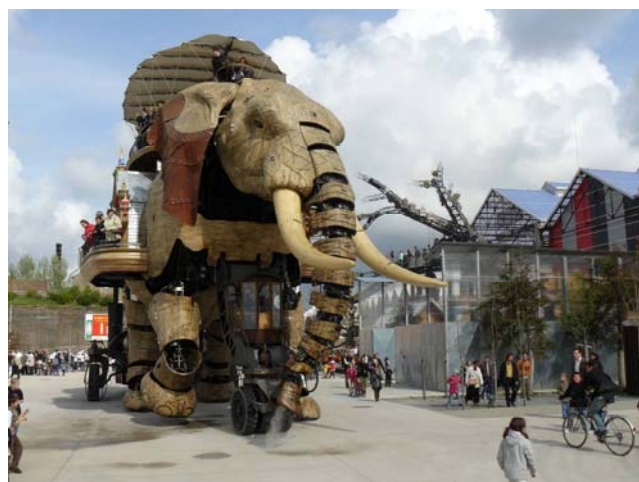
Figure 3. Première machine de l'île, l'éléphant mécanique, symbole conflictuel de la requalification des anciens chantiers navals nantais. Photo : Barthel, août 2007.

Passés à la moulinette de multiples critères d'évaluation (valeur stratégique, qualité de l'expérience de visite, approche de présentation et de mise en valeur, croissance socio-économique, intérêts des clientèles), les sept projets ont été notés. Et au final, « aucun des projets envisagés par les divers promoteurs nantais ne porte en lui toutes les conditions pour être l'équipement culturel et touristique majeur de l'île de Nantes » (Cultura, p. 56). De fait, il aurait fallu qu'un projet atteigne une pondération dépassant les 200 points. Les mieux notés sont le projet « Explorations » (168 points) et le musée de la traite et de l'esclavage (151 points). Dernier de la liste... le projet des « Machines » avec un petit score de 84 points. Pourtant bien noté sur sa capacité à faire venir des touristes à Nantes, l'évaluation du bureau d'études Cultura est sans appel : un projet « sans contenu et sans lien avec l'esprit du lieu, fondé trop uniquement sur le ludique » (Cultura, p. 61).