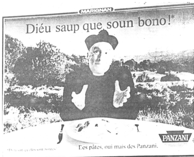
Figure 4 : Campagne publicitaire pour les pâtes Panzani 10

Mais la baisse la plus remarquable des manifestations publiques de la langue a eu lieu dans les années 1950-1970, au plus fort de la pression diglossique française, au moment où la transmission de la langue diminue fortement au sein même des familles : aujourd'hui, la plupart des locuteurs actifs ayant reçu la langue de leurs parents sont des ouvriers ou des employés vivant dans les Alpes de Haute Provence, dans le Var ou dans le Vaucluse, âgés de 50 à 70 ans et habitant des zones urbaines de taille moyenne (Blanchet et al. , à paraître). C'est à partir des années 1980 qu'on voit apparaître de nouveaux affichages publics en provençal, phénomène qui va s'amplifier à partir de 1990 et toucher notamment la signalétique urbaine, mais pas uniquement 9 : le marketing s'empare du provençal qui apparaît désormais sur des noms de produits, des publicités affichées sur la voie publique (Figure 4, 5 et 6 ; Blanchet, 2001), etc.