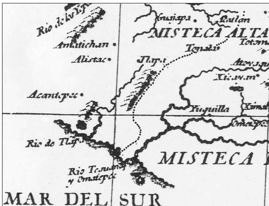
Figure 1 La route Tlapa-Marquelia à l'époque coloniale (en pointillé) (modifiée d'après De Solís 1996)

(voir fig. 1) et incarne à elle seule toute l'histoire de la marginalisation géographique des habitants autochtones de la Montagne. Comme le souligne Villa Arias, «... durant la période coloniale la route reliant la Montaña à la mer fut très importante, et les commerçants, tant autochtones qu'espagnols, défiaient le paysage accidenté, convaincus que celui qui dominerait la route de la mer verrait son succès assuré » (Villa Arias 1999).