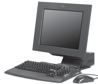
1. Le NetVista x40 d'IBM (2000). En ligne : http://www-5.ibm.com/es/press/fotos/20aniversario/

entre l'œil, l'esprit et le geste) que l'utilisateur s'inscrit corporellement dans le champ d'exercice de l'objet. Il s'agit donc de caractériser, voire de catégoriser les objets informatiques par leur usage, c'est-à-dire selon une approche a posteriori et non pas a priori , sur leurs seules fonctions. L'étude détaillée et concrète de deux micro-ordinateurs laisse ainsi apparaître un schéma de détermination particulier (une modélisation de l'usage), qui assigne une limite large au domaine d'investigation. Cette typologie n'est dès lors valable que pour le domaine analysé et ne saurait être envisagée comme un modèle prédictif. C'est d'ailleurs l'intérêt du système sémiotique que de travailler à partir du corpus et d'occurrences synchroniques.