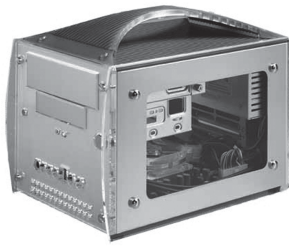
2. Le G-Cube d'Advance (2003). En ligne: http://img.clubic.com/photo/00034145.jpg

nombreuses vis (quatre par côté) ostensibles, qui procurent au boîtier une forte cohésion, ainsi qu'aux formes rectangulaires (bords, baies) qui confèrent une stabilité à l'ensemble. Les vis apparentes indiquent la possibilité de démonter le boîtier pour y installer de nouveaux composants techniques. Les faces externes sont surlignées de bords arrondis en plastique transparent. La face antérieure, qui comporte les diverses prises et baies, se voit ainsi mise en avant, par l'effet d'encastrement créé. Ce mini-PC a la particularité d'être doté d'une poignée non amovible, qui invite à le transporter ou le déplacer, le libérant ainsi des contraintes habituelles de l'ordinateur – son immobilité spatio-temporelle. Mais avec cette indépendance spatio-temporelle à l'aide de la poignée, se greffe une nouvelle contrainte: l'impossibilité d'utiliser le G-Cube comme un meuble, aussi petit soit-il, sur lequel on peut poser des documents, livres, cédérom, etc., tout ce que l'on fait avec un boîtier, ce qui limite évidemment son utilité à sa stricte fonction informatique.