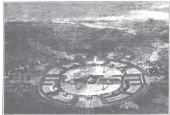
Planches extraites de L'architecture considérée sous le rapport de l'art, des mœurs et de la législation , 1804. Ledoux, 1994: respectivement 65 et 76.