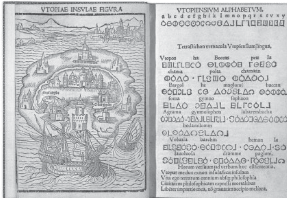
L'île d'Utopie en frontispice de l'édition originale de L'Utopie de Thomas More (1516). Fac-similé reproduit dans Sargent et Schaer, 2000 : 114.