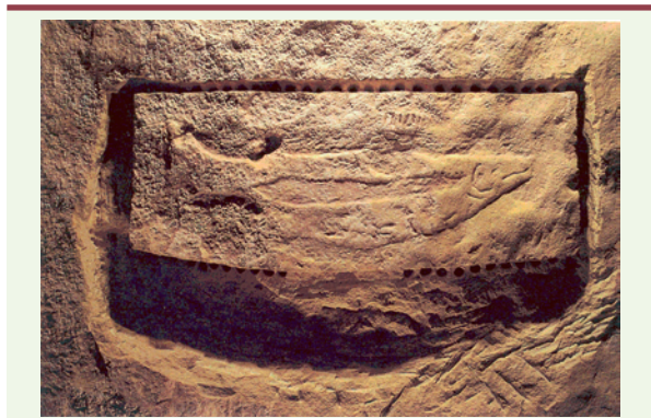
Figure 1. Image d'un saumon mâle adulte gravé il y a 25 000 ans au plafond d'une grotte dans le Périgord, en France (avec la permission du Dr N. Aujoulat, Centre national de la préhistoire, Périgueux).