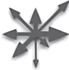
Figure 1 : Représentation du chaos.

Des représentations fixistes d'un état ordonné du monde à celles d'un monde en constante métamorphose caractérisé par l'irréversibilité, l'indétermination et l'aléa, le regard de la science s'est transformé au gré de l'émergence, selon Warren Weaver, dans un article qui fera date (1948, 536-544), de trois paradigmes : le paradigme de la simplicité de 1600 à 1800 (de Galilée et Descartes à Lavoisier et Laplace); le paradigme de la complexité désorganisée à partir des travaux de Carnot, Clausius et Boltzmann sur la thermodynamique et la cinétique chimique; enfin le paradigme de la complexité organisée à partir des travaux sur la cybernétique et les sciences de l'information correspondant à l'époque de la fabrication des premiers ordinateurs dans les années 1940. Dans la continuité d'une perspective généalogique sur la transformation de cette notion, il faudrait ajouter l'émergence d'un quatrième paradigme : la complexité organisante qui résulte, comme nous allons le voir, de la différenciation entre l'inerte et le vivant, entre « machines triviales » artificielles et déterministes, et « machines non triviales » (Morin, « Complexité restreinte » 39).