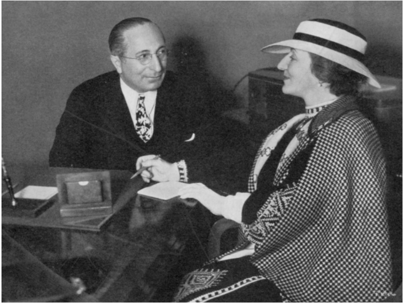
Hollywood, 1935 : Louis B. Mayer dicte un message aux lecteurs du Digest ( Canadian Moving Picture Digest, 25 mai 1935).