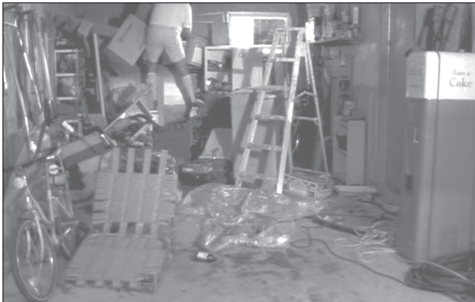
Figure 11 Représentation du « garage » dans le film Elvis Gratton