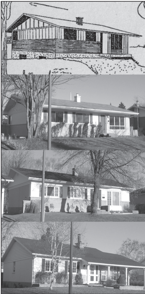
Figure 13 Le modèle d'un bungalow et quelques-une de ses variantes, rue Toronto à Québec (Sainte-Foy)

Source : Extrait d'une publicité parue dans L'Appel (1961, 6) et photos de Luc Noppen.