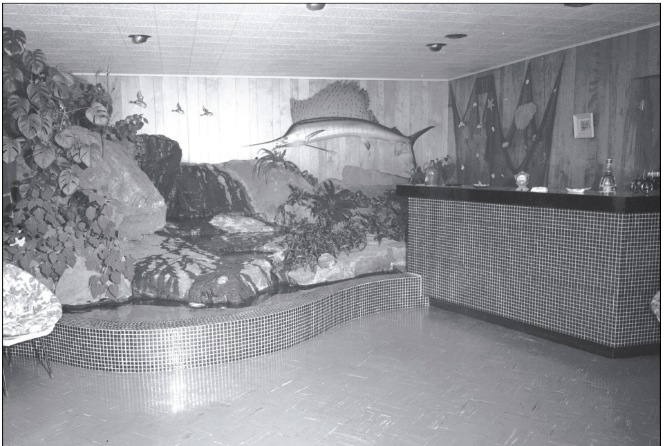
Figure 12 Un sous-sol aménagé en salle de divertissement et bar à Québec

Chambre ou musée, discothèque ou salle de jeux, le sous-sol s'avéra ainsi, au fil du temps, l'un des espaces privilégiés du bungalow québécois – qu'il finit d'ailleurs par surhausser, puisqu'on fenêtra le soubassement pour l'éclairer (figure 12). La réforme du système québécois de l'éducation entreprise au milieu des années 1960 à la suite du « rapport Parent » ( Rapport de la Commission royale d'enquête sur l'enseignement de la province de Québec , 1964) en remplaçant les pensionnats par les