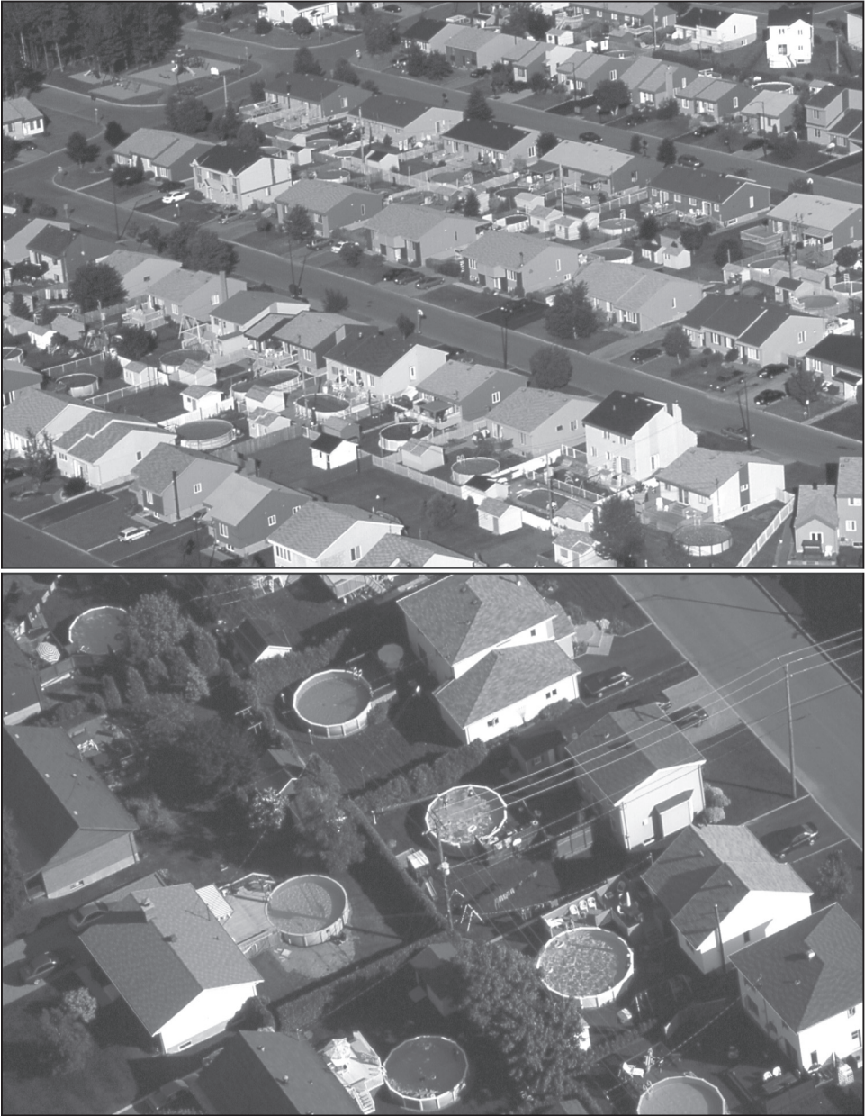
Figure 7 Mythe ou réalité : vues aériennes de l'équation « banlieue-barbecue-bungalow-piscine hors terre » (plusieurs bungalows paraissent modifiés par rapport à leur état originel).