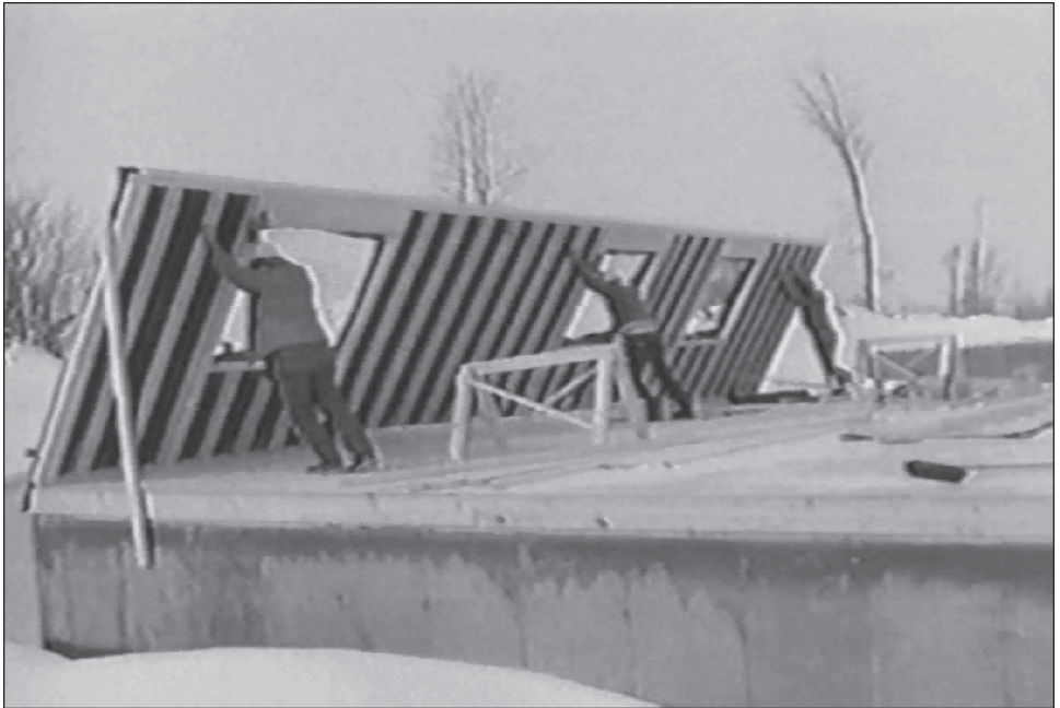
Figure 2 Représentation quasi caricaturale de la facilité de construction: « l'assemblage » d'un bungalow