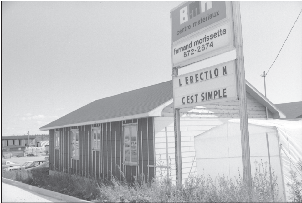
Figure 1 Le bungalow « d'érection simple »