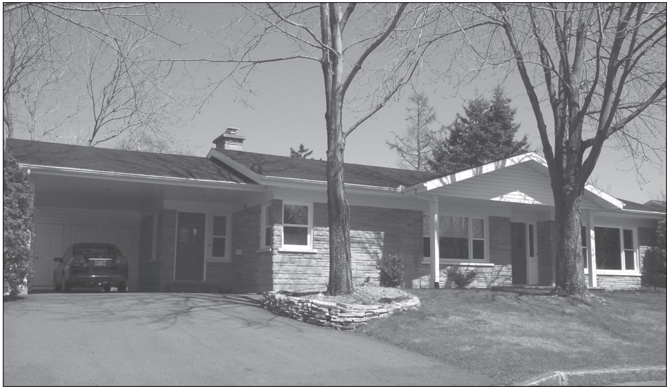
Figure 10 Le carport du bungalow : simple prolongement du toit et facilement « ajoutable », celui-ci a été partiellement « fermé » pour, comme dans de nombreux cas, devenir une pièce supplémentaire de la maison. Sillery (Québec)

Redevance du « bungalow à long pan » à l'automobile qui rendait possible, à l'échelle urbaine, son terrain oblong, l'abri d'auto, mieux connu au Québec sous le nom de carport et considéré à ses débuts comme une variante économique du garage 18 , devint dans les années 1960 le compagnon presque forcé du bungalow 19 (figure 10). Certes, la SCHL, déjà en 1960, constatait déjà que « The automobile and its requirements tend more and more to dominate the design » (CMHC, 1958 : III-1). Au Québec cependant, sans doute sous l'effet conjugué du climat et de la primauté de la cuisine du bungalow, l'abri d'auto, au fil des hivers, reporta sur la façade latérale l'entrée principale de la maison, allant jusqu'à condamner l'entrée de façade principale. Celle-ci, dont on avait souvent supprimé le hall 20 afin d'élargir un salon réduit à sa plus simple expression par l'expansion de la cuisine-salle de famille 21 ,