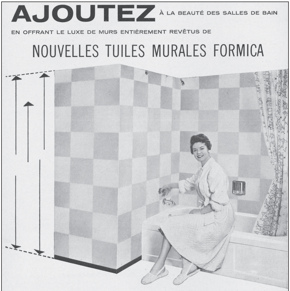
Figure 8 La « révolution des salles de bain » et les nouveaux matériaux

Source : Publicité parue dans Bâtiment , octobre 1959, p. 4.