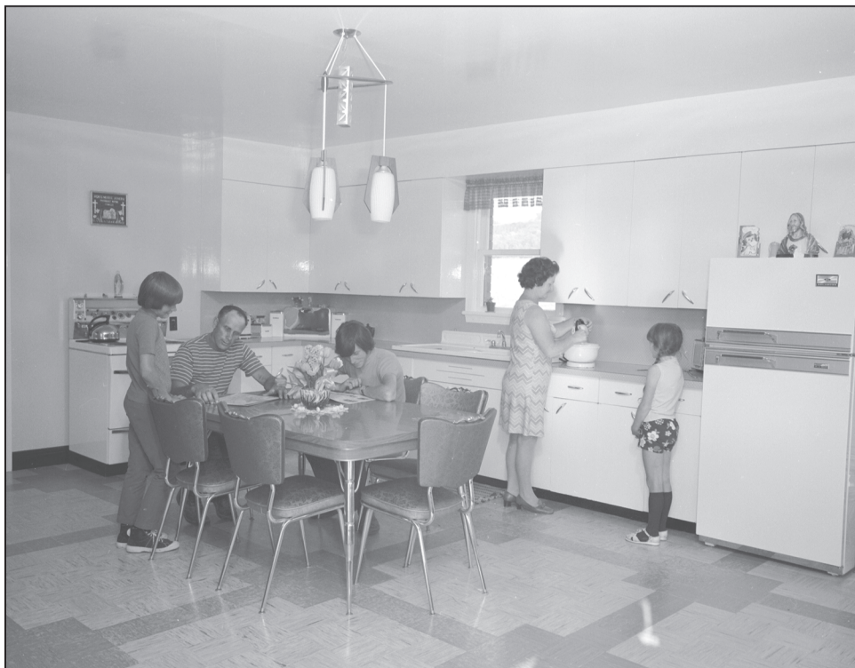
Figure 9 Une cuisine-salle familiale, à Arthabaska