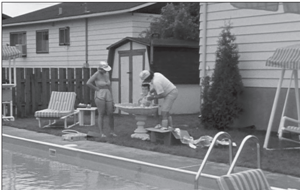
Figure 6 La représentation de l'appropriation de la cour arrière du bungalow, de sa piscine, de ses ornements et de son cabanon, livrée par le film Elvis Gratton