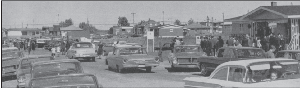
Figure 3 La « parade » des Bois-Francis, 1964