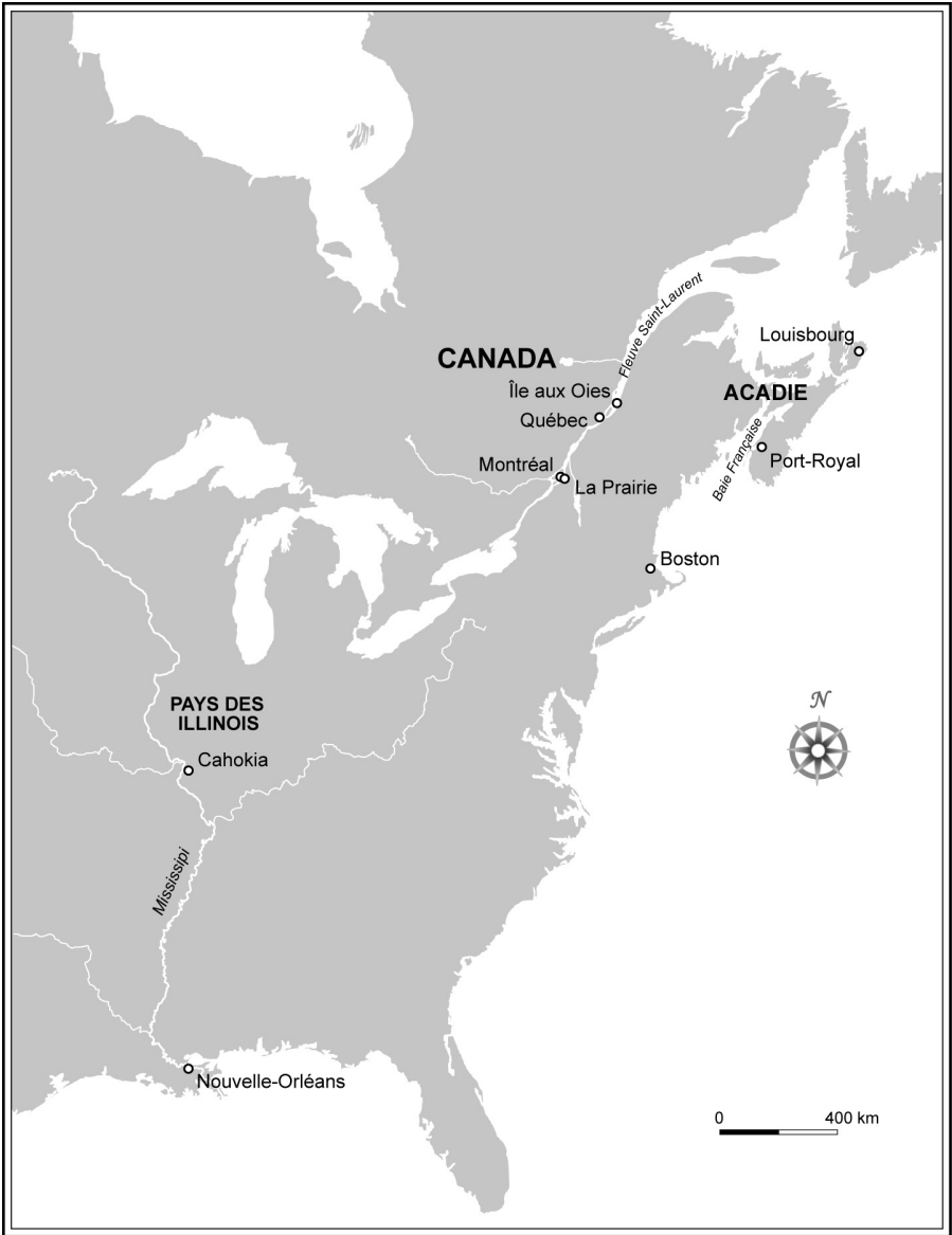
Sites et lieux mentionnés. (Infographie : Andrée Héroux).