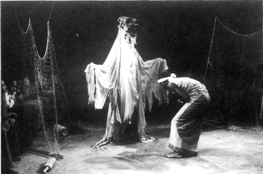
Njaa poursuit la famille.

Il y a trois rivières. Dans la première, IKENGESHA, la Prévoyance, Tu pêcheras tout ce qu'il te faudra. Dans la deuxième, ITUMPIKA, l'illusion, Tu pêcheras tout ce que ton orgueil te dira. Mais dans la troisième, IBONA, la Fatalité, Tu ne pêcheras surtout pas.