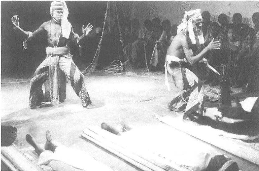
« Réveil des morts ».

Mon père, mon père, Tu m'as donné des bras, tu m'as donné des jambes, Tu m'as donné une hache, Tu m'as montré le chemin, Mais tu es parti errer, me laissant seul.