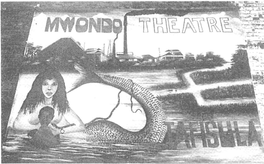
Tableau mural de Louis Kalema.

Entre 1975 et 1977, Tafisula a été jouée plus de 500 fois devant des publics divers : dans son théâtre et dans les amphithéâtres de la Gécamines ; sous un chapiteau au Festival du théâtre de Nancy ou au Musée africain d'Amsterdam ; en tournée à l'intérieur du Zaïre, éclairée par des projecteurs alimentés par une batterie de camion. Le spectacle dont je témoignerai ici a eu lieu au siège du Mwondo à Lubumbashi pour un public parlant le swahili et le français. Comme le seul support matériel du texte était le corps (les corps) des comédiens et comédiennes, ma description s'appuie sur les notes de mise en scène, le programme du spectacle (avec les traductions des chants), les textes de promotion, les critiques journalistiques et sur un film réalisé par Télézaïre. Je rendrai compte pas à pas du déroulement de la représentation selon ses trois étapes : la pénétration du monde symbolique, la distorsion de la réalité sociale et la fin qui est un retour à la case départ.