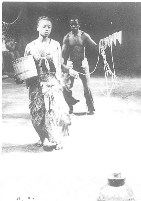
« La femme d'Ikengesha ».