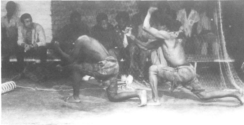
« La pêche dans Itumpika ».

La femme lui tend la ligne qu'il doit relancer dans Ikengsha. Une main à l'autre bout de la salle attrape la corde. Le couple tire la prise de l'eau. Six hommes habillés de pantalons verdâtres émergent, accueillis par la femme comme des frères. Elle leur présente son nouvel époux et leur ordonne de satisfaire tous ses désirs. Les acteurs miment le labourage puis déposent aux pieds du héros le fruit d'une moisson prodigieuse. Mâchant distraitement une carotte de manioc, il exige de goûter aux eaux d'Itumpika : que ses serviteurs construisent des pirogues et lancent des filets dans la deuxième rivière ! Des chansons de pêcheurs accompagnent la pantomime de la construction de la pirogue, puis le départ pour la pêche 8 . Les acteurs avancent en tirant sur les filets de pêche qui entourent la salle.