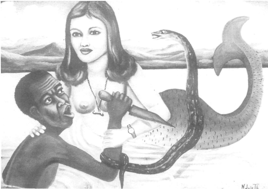
« Mami Wata de la deuxième visite à Ibona ». (Peinture de Ndaic Tb).

Le patron retourne à l'Ibona avec son offrande pour la créature de l'eau qu'il invoque. Une autre image apparaît dans les tons de bleu-gris, celle d'une femme qui porte la montre habituelle, mais aussi un collier auquel pend un petit os. Dans sa main droite, elle tient le cou d'un homme noir. L'homme brandit un couteau dans sa main droite, mais celle-ci est menottée par la main de la Mami Wata et la queue d'un serpent. La même voix à l'accent anglo-américain accompagne la projection. « Le sang d'une poule ! », ricane la Mami Wata. « J'ai dit trois gouttes de sang de ta première femme ! »