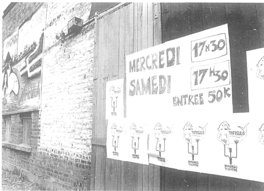
Mur extérieur du théâtre.