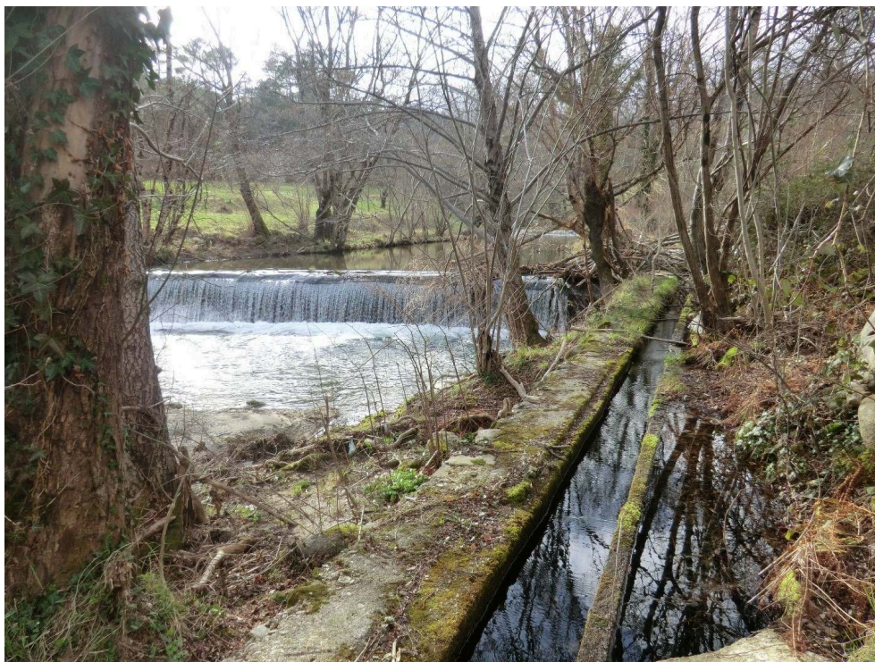
Figure 5. Béal longeant la Gardonnette et illustrant la proximité entre canaux et rivière.