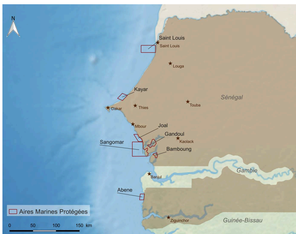
Figure 1. Localisation et contours des sept AMP étudiées (Sénégal).

l'ensemble des aires marines protégées et réserves naturelles communautaires du pays qui sont au nombre de onze officiellement enregistrées et disposant de décret de création. Ainsi, il a été procédé à un échantillonnage afin d'en retenir sept qui sont devenus notre univers de travail. Les sites choisis sont parfaitement représentatifs pour mener une étude sur la gouvernance des aires marines protégées au Sénégal et extrapoler à l'échelle nationale. Le choix des sept AMP (Saint-Louis, Kayar, Gandoul, Sangomar, Joal-Fadiouth, Bamboung et Abéné) a été ainsi fait suite aux entretiens réalisés en décembre 2016 avec les experts et sur la base de critères de faisabilité définis à l'avance (accessibilité, connaissance personnelle du milieu) et d'importance de l'activité de la pêche (unités de pêche mobilisées, acteurs engagés et volume des débarquements) et, enfin, en rapport avec leur expérience de la gouvernance participative (cogestion) (pionnier, existence d'un plan de gestion de l'AMP). En mettant en place ces critères, l'AMP de Niamone - Kalounayes récemment créée en 2015 et n'existant que sur le papier a été exclue de l'étude (Thiao et Laloë, 2012 ; CCLME, 2013 ; Ecoutin, 2013 ; Mbaye et al., 2013 ; Dème, 2018 ; Cormier-Salem, 2015). Il en est de même des réserves communautaires avec des activités de pêche relativement faibles ou quasi inexistantes.