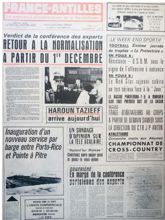
Figure 4. Une du France Antilles Guadeloupe du 19 novembre 1976.