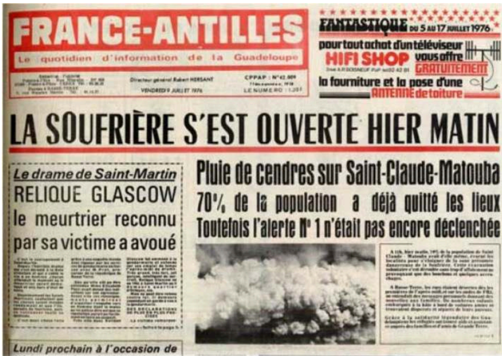
Figure 2. Une du France Antilles du 9 juillet 1976.