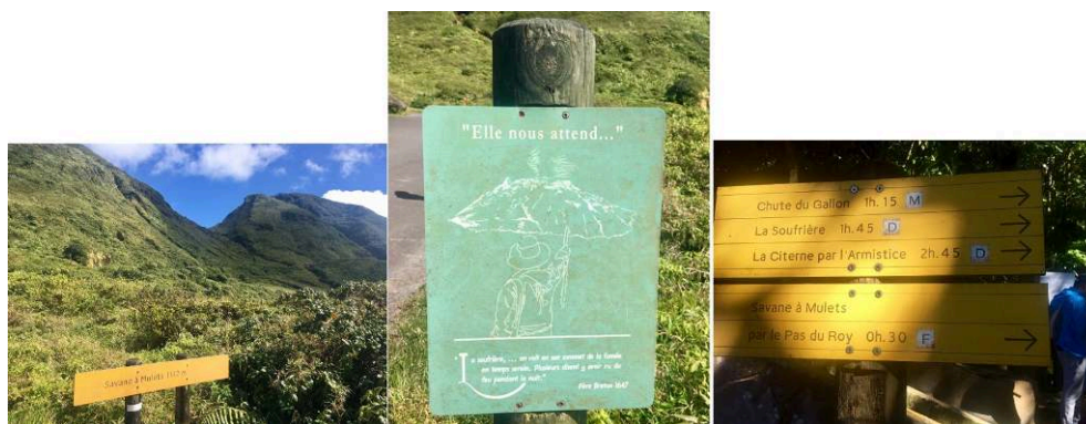
Figure 6. Exemples de panneaux le long du sentier de randonnée de la Soufrière.