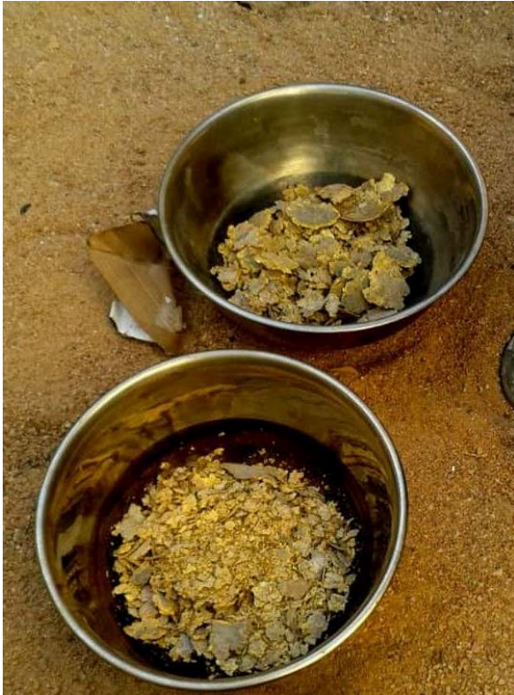
ORPAILLEUR DE TABELOT, 2014 / GOLD DIGGER OF TABELOT, 2014.