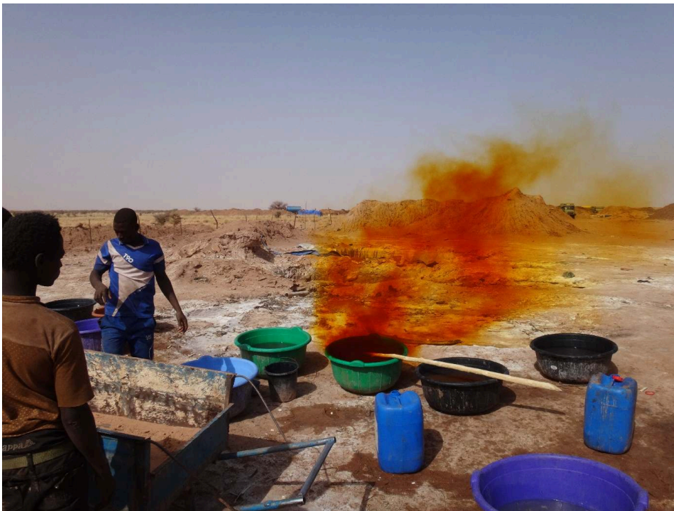
Afane, mars 2019.