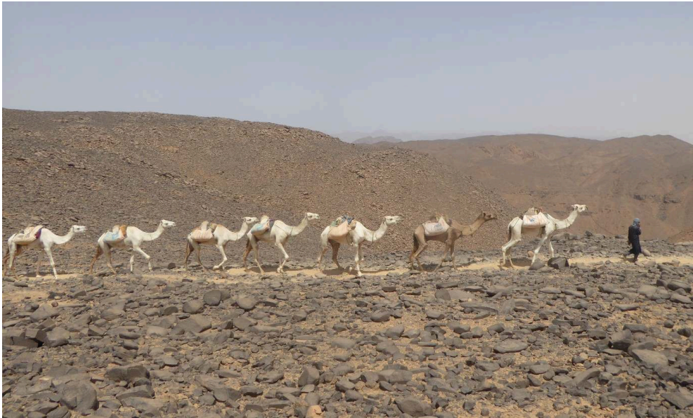
A. Ahmed, août 2020.