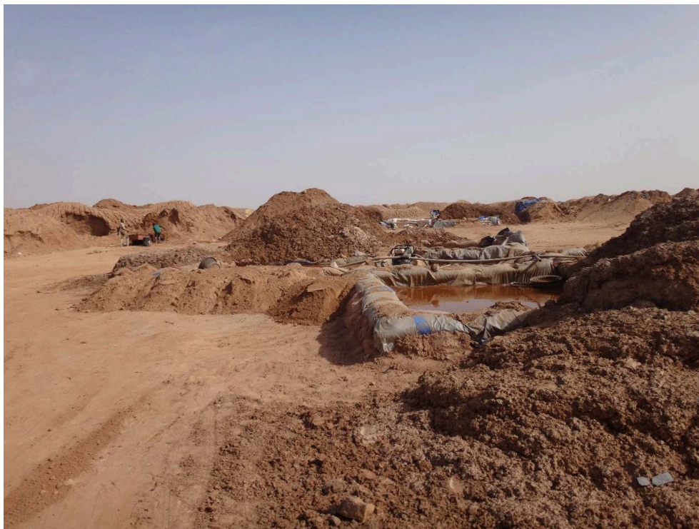
Figure 8. Haldes stockées et bassin de lixiviation sur le site de traitement par cyanuration près d'Agadez / Stockpiles and leaching basin at the cyanidation processing site near Agadez.

minéralisés. Enfin, en cas de demande, elles sont dans l'obligation de restituer à tout orpailleur ses résidus.