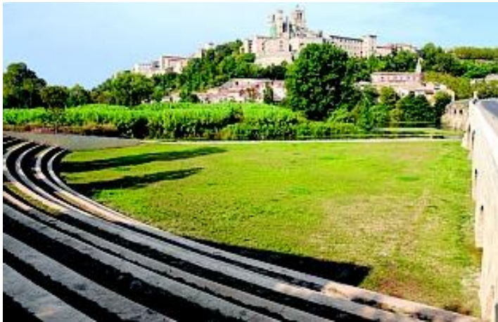
Figure 2. Un ouvrage de protection contre les crues devenu lieu de culture