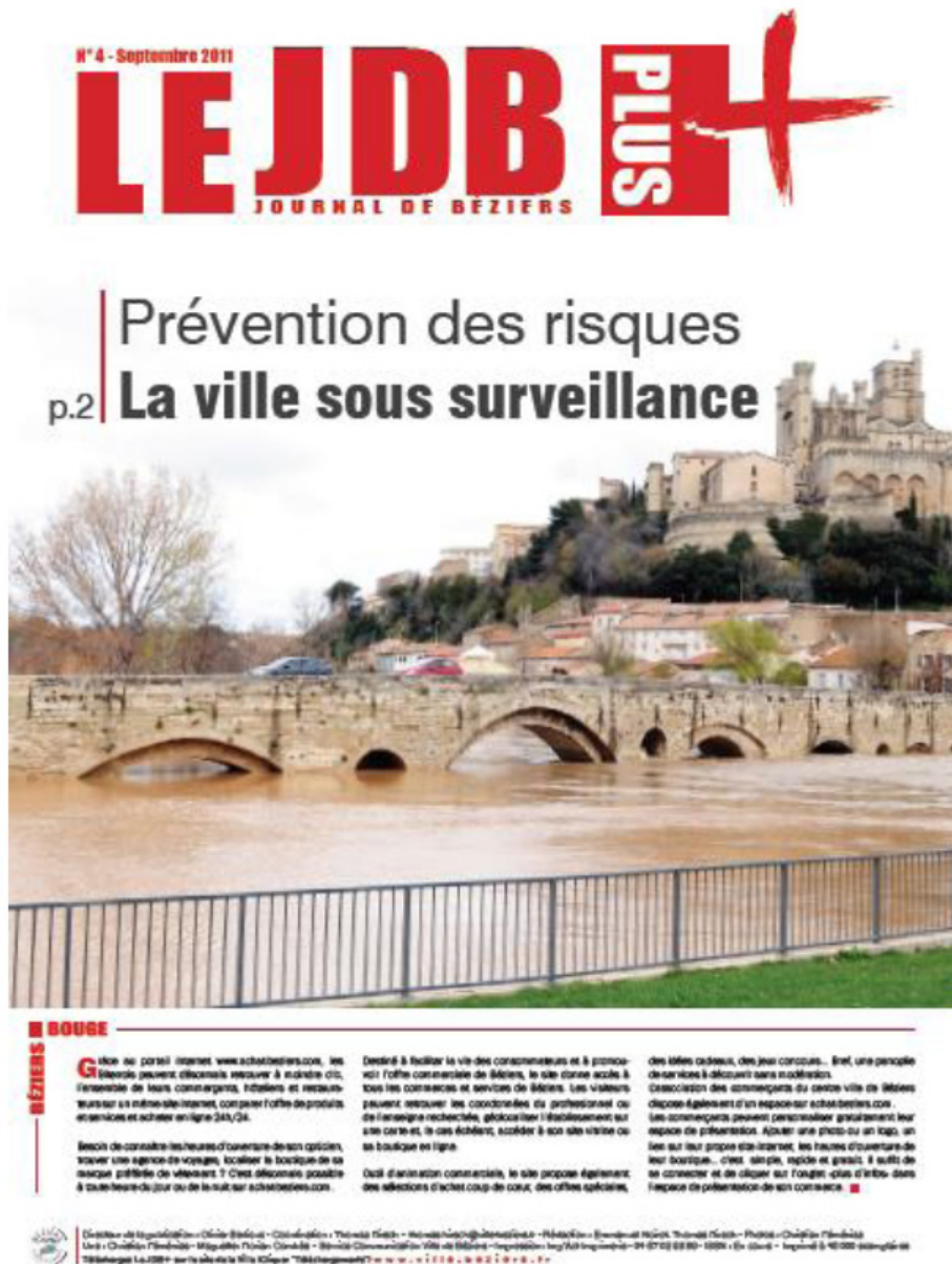
Figure 4. Mise en visibilité des inondations par les médias locaux.