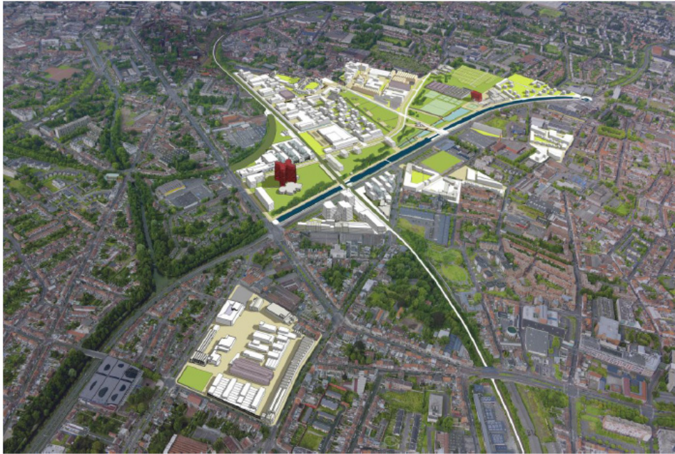
Figure 3. Plan de développement et d'aménagement de l'écoquartier de la Zone de l'Union du Lille Métropole Communauté Urbaine