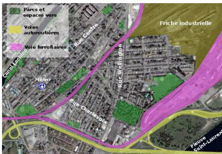
Figure 1. Le Quartier Pointe-Saint-Charles (Montréal, Québec) et des éléments urbains significatifs de son environnement.

9 Ce quartier est fortement marqué par le développement industriel (Figure 1). Il est ceinturé par un réseau autoroutier et ferroviaire. Le quartier est séparé en son centre par la voie principale de communication ferroviaire canadienne.