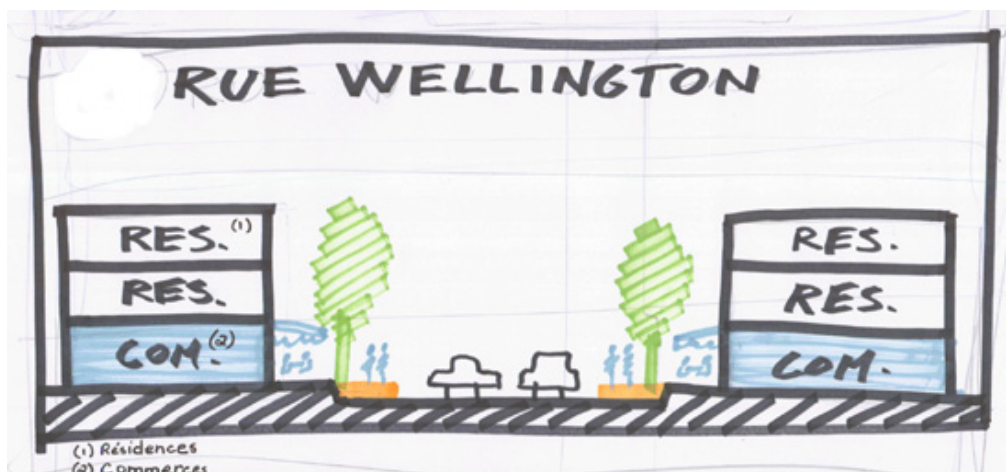
Figure 4. Proposition citoyenne pour remettre en valeur une artère commerciale