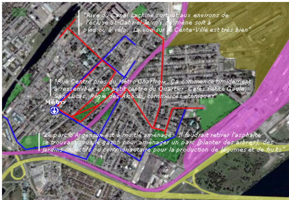
Figure 2. Exemples de données récoltées grâce à la carte citoyenne