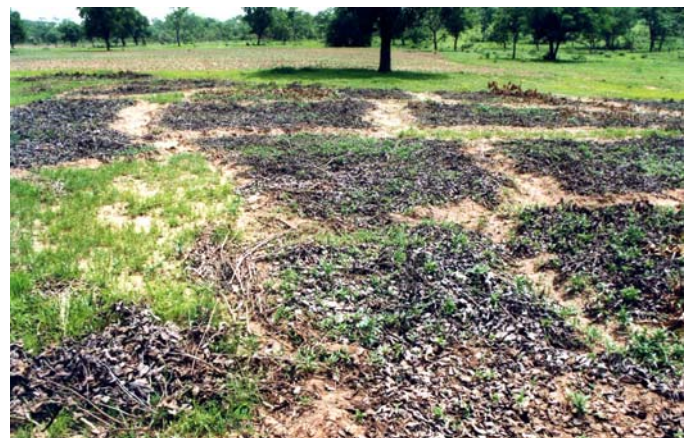
Figure 3. Les Coleus lèvent à travers le paillis.