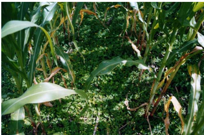
Figure 8. Maïs en SCV sur couverture vive ( Arachis pintoi ) : Ce système excluant le riz, n'a pas été adopté par les paysans malgaches (Madagascar, Hautes terres, site de référence TAFE)