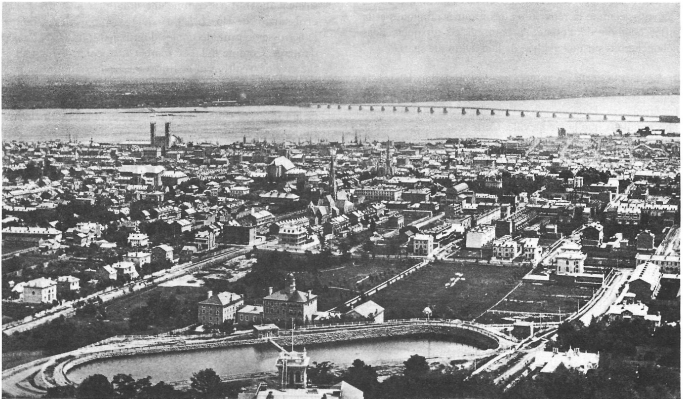
FIGURE 3. Ce panorama donne une bonne idée du développement de Montréal en 1865. L'ouverture récente du pont Victoria et les activités portuaires font de la ville la plaque tournante de l'économie canadienne. Au premier plan, on aperçoit le réservoir McTavish et le campus de l'université McGill.

L'étude d'une société urbaine pose le problème de sa stratification. Pendant longtemps, l'historiographie canadienne avait privilégié le clivage ethnique mais, au début