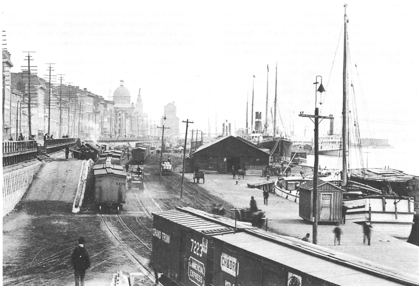
FIGURE 4. Cette photo du port de Montréal vers la fin du 19 e siècle (1880-1890) montre l'étendue des activités portuaires. On y voit l'ampleur des installations avec le silo, les hangars, le chemin de fer et l'éclairage. On remarquera également la coupole du marché Bonsecours et une partie de la chapelle de Notre-Dame-de-Bonsecours.