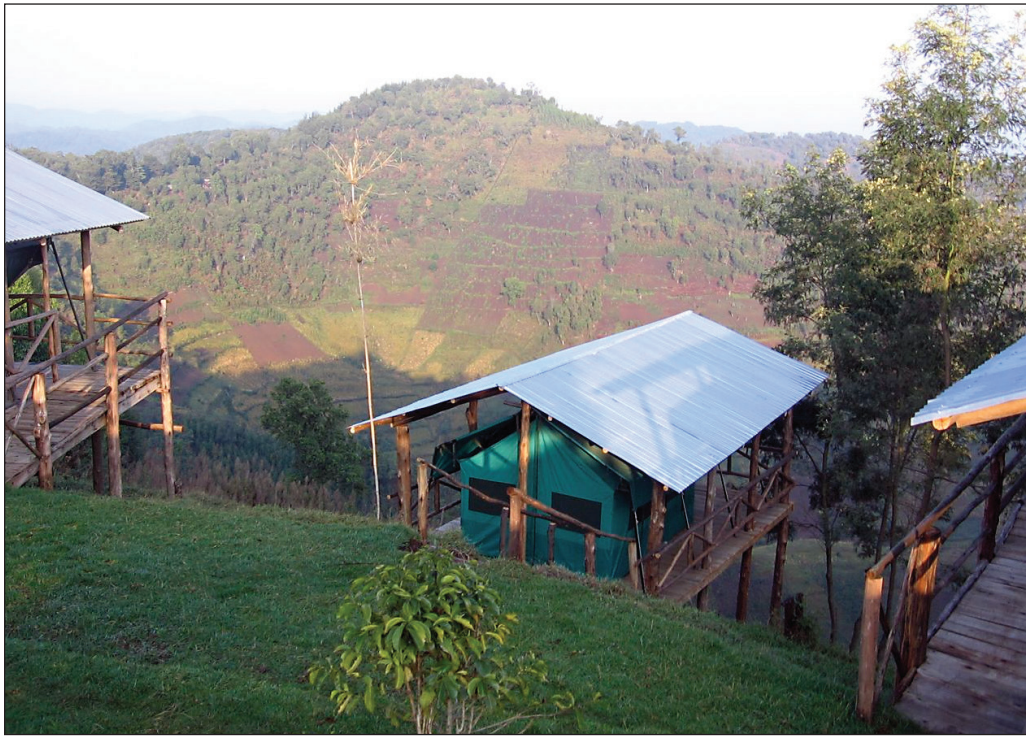
ILLUSTRATION 2 : Le campement de tentes des Amis des gorilles, à Ruhija (photo : avec la gracieuseté de M. Campbell).

de 400 visiteurs et généré un revenu de plus de 16 millions de Shillings ougandais (approximativement 6 800 $ US) (Campbell et al. , 2011b).