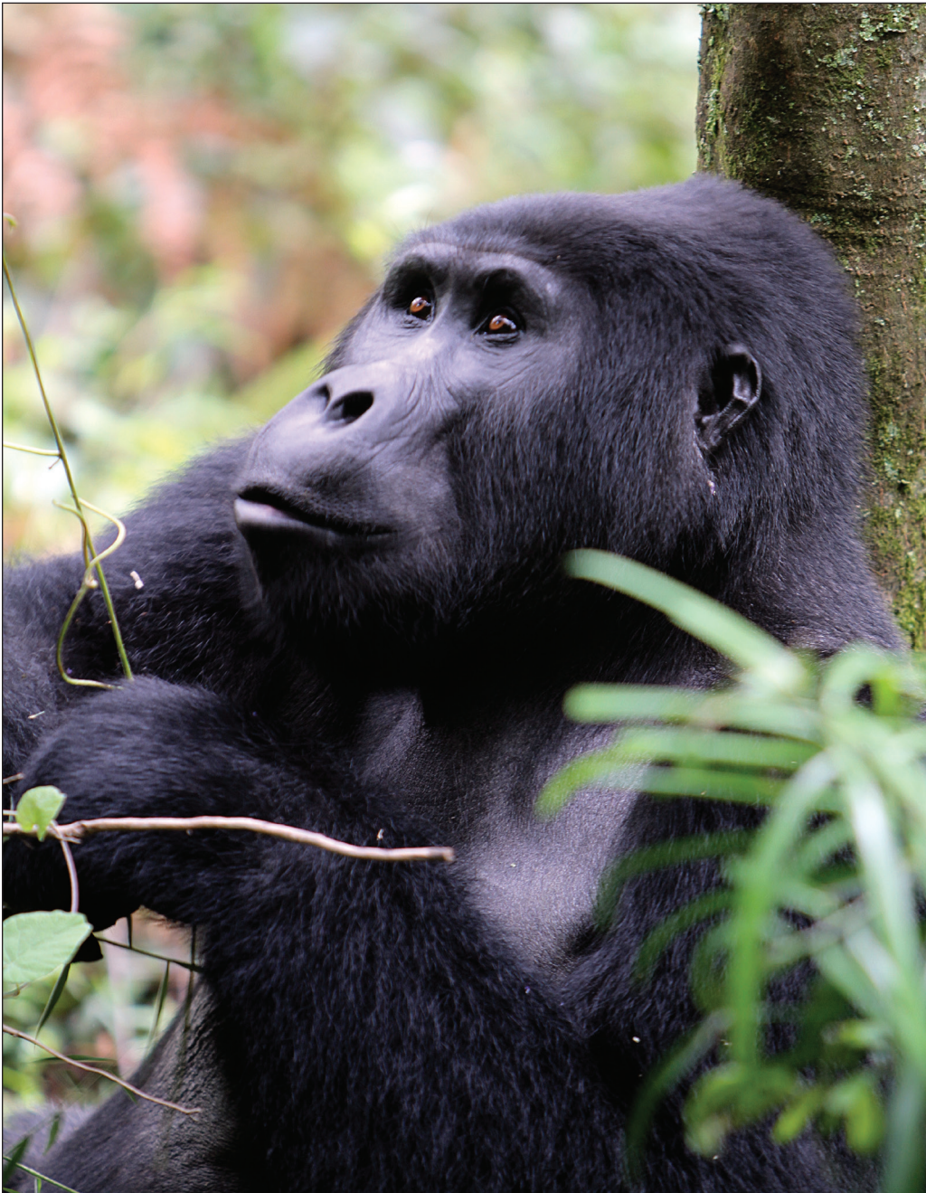
ILLUSTRATION 1 : Gorilles des montagnes ( Gorilla Berengei Berengei ) (photo : avec la gracieuseté de M. Campbell).

Une récente étude critique de Laudati (2010) expose la complexité des questions qui émanent de l'intersection entre la conservation bien intentionnée, le tourisme et la réduction de la pauvreté rurale à Buhoma, un village adjacent au parc national Bwindi Impenetrable en Ouganda et un important point d'entrée pour le pistage des gorilles. Les préoccupations relatives au contrôle, au pouvoir et à l'accès sont à l'origine du discrédit de l'indépendance et de l'amélioration des moyens d'existence (Laudati, 2010). Même s'il y a d'innombrables exemples infructueux de tourisme favorable aux pauvres dans lesquels les coûts dépassent les bénéfices, les principes de