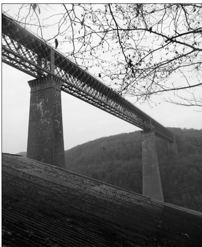
ILLUSTRATION 5 : Viaduc des Fades, Sioule et patrimoine.