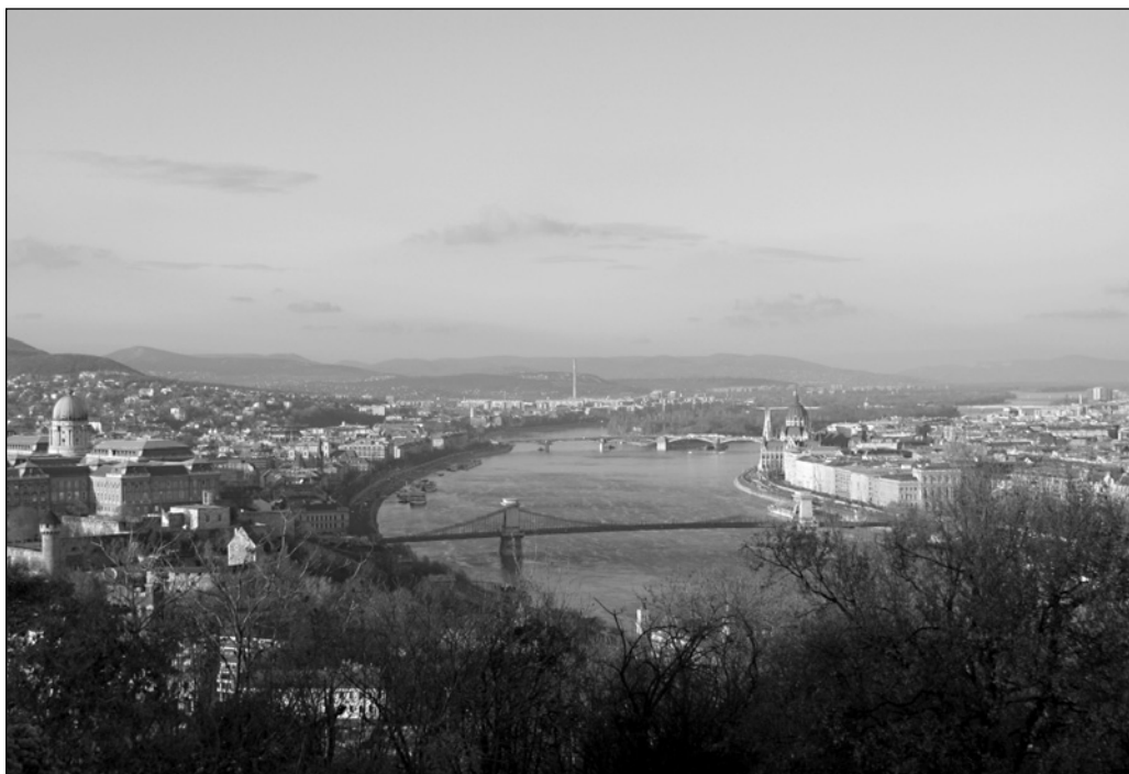
ILLUSTRATION 1 : Le panorama du Danube vu du Mont Gellért.