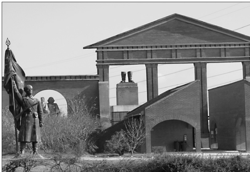
ILLUSTRATION 6 : Le Memento Park (photo : Maie Gérardot).

Le tourisme peut également jouer un rôle dans la mise en valeur d'un autre type de patrimoine, le patrimoine hérité de la période soviétique. Ce dernier ne se trouve pas au cœur de la ville, contrairement aux sites UNESCO ou au quartier juif, mais à sa périphérie. Toutes les traces du passé soviétique de Budapest ont en effet été regroupées sur un vaste terrain, donnant naissance à un nouveau lieu à la fois touristique et patrimonial : le Memento Park, appelé aussi le parc des statues (voir illustration 6). Sa localisation périphérique signifie qu'il s'agit de ne pas oublier le passé soviétique sans toutefois l'exposer au centre de la ville. Au cœur de Budapest, seule la Maison de la Terreur (musée installé dans les locaux de l'ancienne police secrète AVH), située sur l'avenue Andrassy, rappelle cette période.