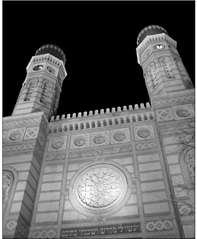
ILLUSTRATION 5 : La Grande Synagogue, monument central du quartier juif.

dans tout cela ? En réaction aux scandales et aux menaces de destruction, de nombreux livres et guides sur ce quartier ont été publiés et de nombreux restaurants juifs ont ouvert. Des touristes visitent aujourd'hui ce quartier particulier, pour des raisons variées : religieuses (avec le rôle très important de la Grande Synagogue, la plus grande du monde après celle de New York, voir illustration 5), gastronomiques, historiques ou encore culturelles. Un tourisme de mémoire se développe également avec le mémorial de l'Holocauste et la mise en valeur du mur du ghetto.