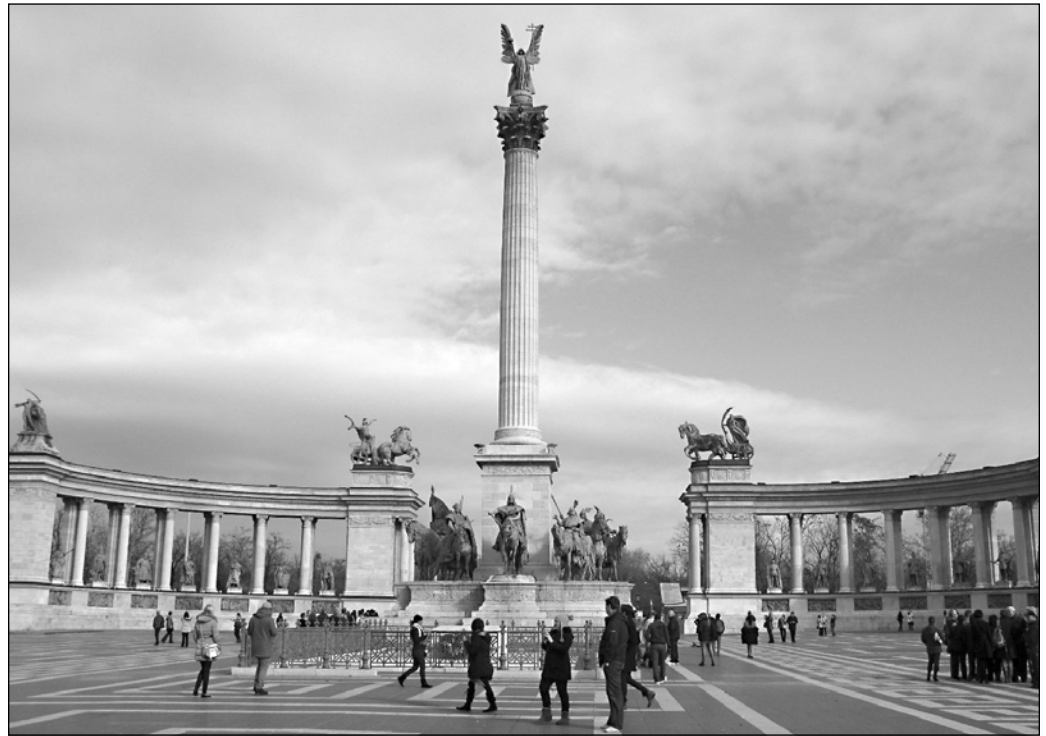
ILLUSTRATION 3 : La place des Héros et le monument du Millénaire.