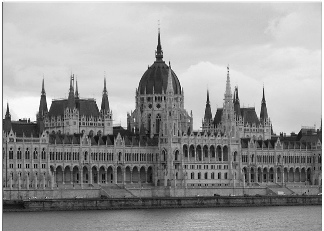
ILLUSTRATION 4 : Le parlement de Budapest.

des mots « Boulevard Culturel Budapest », mais également du logo du patrimoine mondial de l'UNESCO, ce qui permet de souligner d'emblée le lien très fort entre patrimoine, tourisme et culture qui se joue ici.