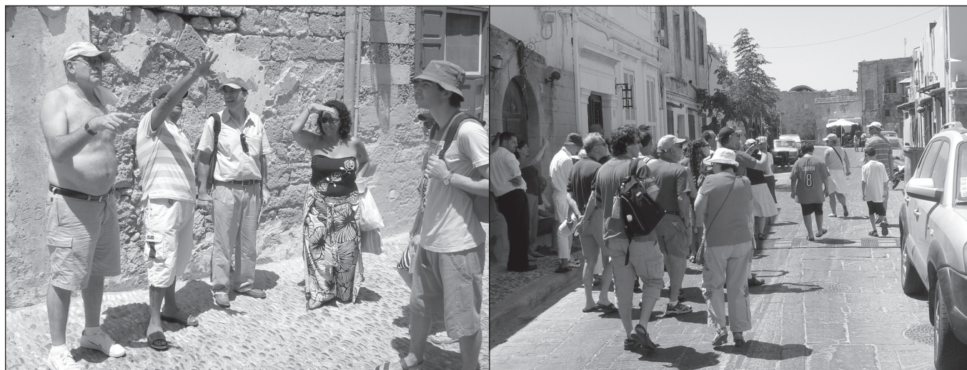
ILLUSTRATION 1 : Visiteurs rodeslis dans les rues de la vieille ville.

revient pas à Rhodes dans l'idée de s'y installer à nouveau ou d'y recouvrer des biens. Les parents de déportés de même génération viennent pour fréquenter, le temps d'un séjour, les ruelles de leur enfance, retrouver l'ambiance de la vieille ville : en deux mots, pour y « sentir leurs racines ». Dans leur cas, le premier séjour s'effectue toujours dans les mêmes souffrances que pour les rescapés des camps de concentration. Pourtant, et malgré ces difficultés, le retour sur l'île semble s'imposer comme une sorte d'obligation morale. C'est une telle attraction qui s'exprime dans les lignes du récit autobiographique de Nisso Pelossof (2007 : 9) : « Si je ressens une attache profonde pour cette région de Picardie qui m'a accueilli, la nostalgie de mes racines, de ma patrie — l'île de Rhodes, — cette nostalgie est de plus en plus prenante au fil des années. [...] L'avenir se dessine progressivement pour moi d'un retour à Rhodes. C'est inéluctable. »