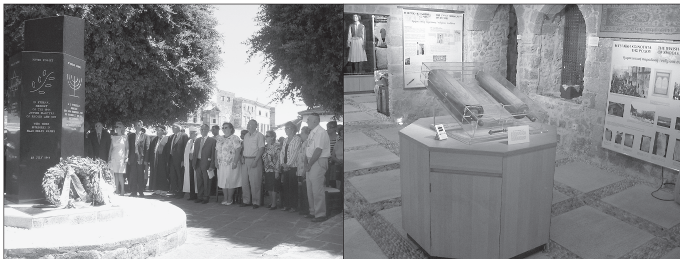
ILLUSTRATION 3 : Lieux et moment de plus grande visibilité de la communauté juive à Rhodes.

la fenêtre pour nous chasser... Ça leur a été facile de prendre l'histoire des gens sans rien payer. Souvent, on se fait refuser le droit d'entrer dans une maison même pour une minute, même pour prendre une photo.