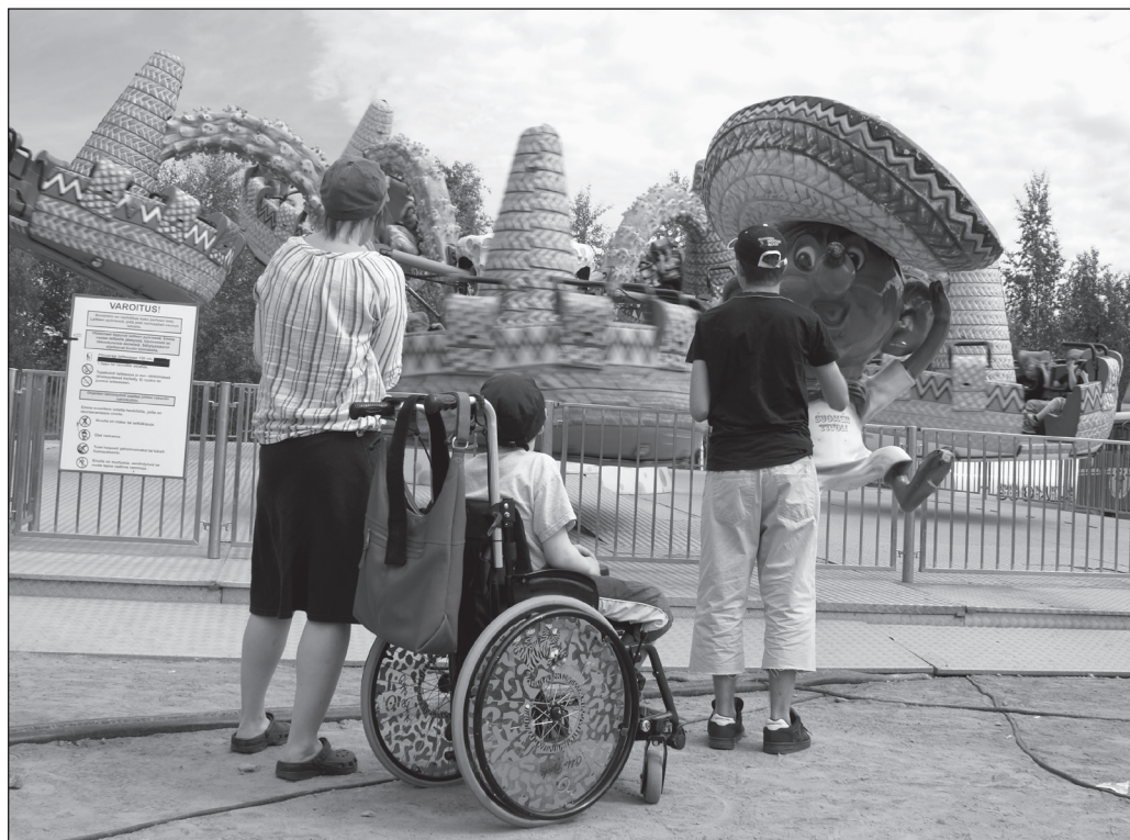
ILLUSTRATION 1 : Sans aménagements, le touriste handicapé peut être privé d'une part importante de l'expérience touristique.

des accueils mineurs, l'intégration d'enfants déficients dans les centres de vacances dits « ordinaires » reste soutenue par une association d'éducation populaire, Jeunesse au Plein Air (JPA), qui élabore dès 1997 une charte déontologique. Pour les séjours des adultes, il faudra attendre l'intervention du Secrétariat d'État au tourisme qui lance, en 1998, la première campagne annuelle de sensibilisation aux vacances des personnes handicapées. Cette politique se poursuit en 2001 par une campagne de labellisation de structures accessibles aux personnes déficientes.