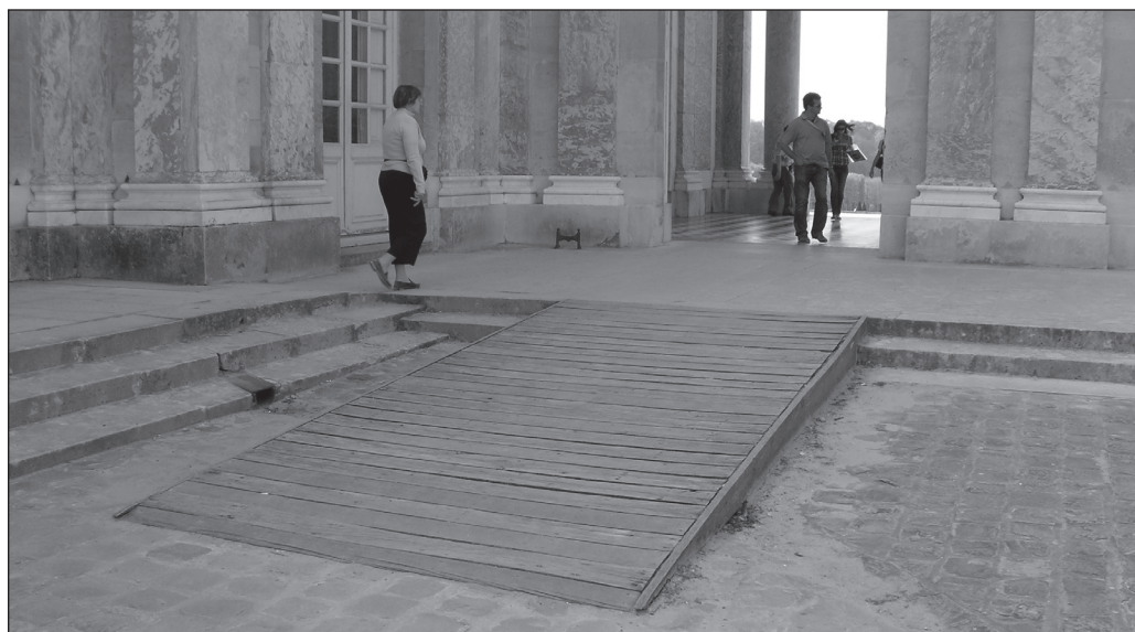
ILLUSTRATION 3 : Rampe d'accès au Château de Versailles.

touristiques et les loisirs accessibles à tous », la région Nord-Pas-de-Calais a lancé une opération de labellisation, sous l'égide de la délégation régionale de l'APF, du Conseil général et régional du Nord. Ce label intitulé « Le tourisme, c'est pour tous », aisément identifiable par un logo, est attribué aux structures touristiques accessibles. En 1997, 120 labels de ce type ont été attribués, près de 300 en 1998 et plus de 330 en 1999. Un autre système de pictogrammes utilisé par Village Vacances Familles (VVF) avec le partenariat de l'APF, consiste en l'application et la diffusion de sigles définissant des catégories de séjours selon leur accessibilité. D'autres labels, soutenus par des fédérations sportives, tels que le label