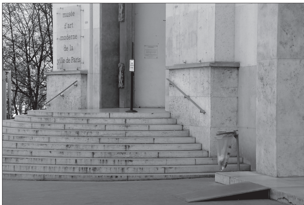
ILLUSTRATION 4 : À côté de l'escalier d'entrée, l'accès adapté du Musée d'art moderne de la ville de Paris.