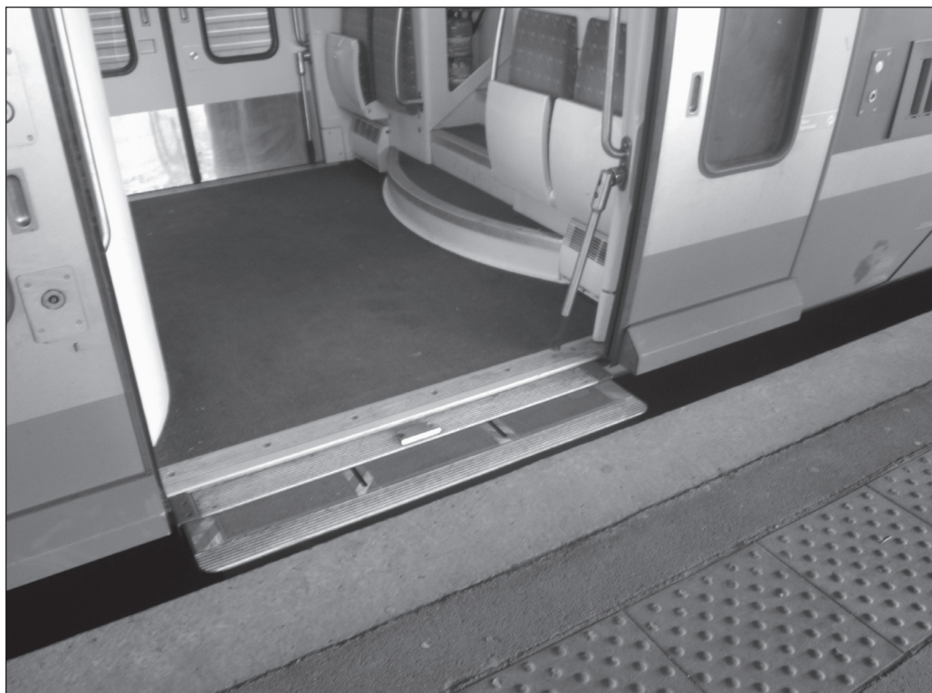
ILLUSTRATION 2 : Passerelle pour l'embarquement des personnes en fauteuil roulant dans un train à quai.