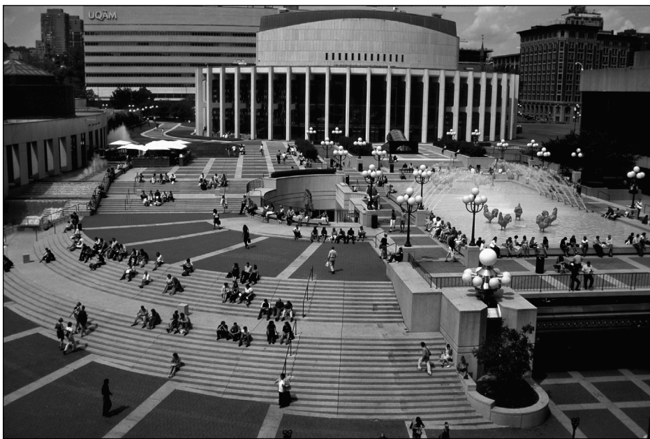
Esplanade de la Place des Arts, Montréal.

Cette perception réductrice du tourisme et du touriste touche aussi celui qui se consacre à son étude. Si le mot touriste n'est pas utilisé que pour qualifier le spécialiste en « iste » s'intéressant au tourisme, bien heureusement, il sert néanmoins à le percevoir négativement par ceux souvent qui partagent la même origine disciplinaire. Par exemple, « les sociologues et les économistes (et les