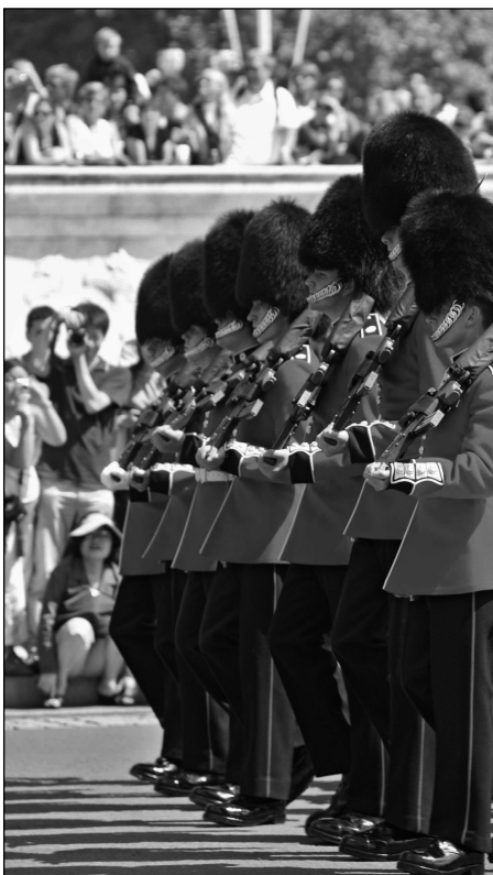
Des touristes regardent la relève de la garde royale à Londres.

L'analyse de cette complexité spatio-temporelle ne requiert pas forcément l'intervention égale et uniforme de spécialistes en tous genres, car elle n'est pas apparente de la même façon en fonction de l'espace et du temps. Sur le plan spatial, par exemple, à petite échelle, la complexité est masquée par la résilience du système touristique ; à moyenne échelle, elle peut être mise en évidence, mais elle ne semble pas nécessairement avoir une influence perturbatrice sur le système ; à grande échelle, la complexité chaotique apparaît très souvent, sinon toujours, selon des hypothèses pour lesquelles nous avons des éléments de certitude, mais qui demanderaient à être explorées davantage (Dewailly, 2006 : 168-176). De même, par exemple, l'apport des historiens sera d'autant plus nécessaire qu'on recule dans le temps, alors que celui des psychologues sera plus facile à mettre en œuvre actuellement que dans le cas d'une situation relative au Grand Tour.