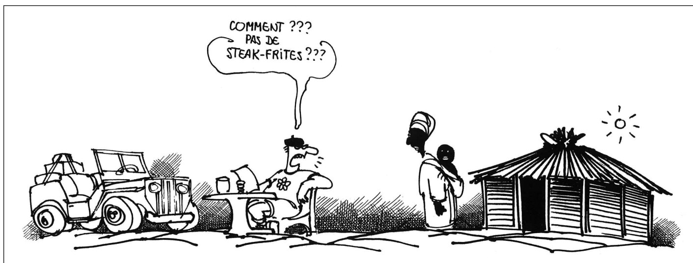
Touristes-rois en Afrique.

C'est d'ailleurs la raison pour laquelle la transparence doit être de rigueur. Car sans une gouvernance transparente, les slogans précurseurs ou flatteurs du solidarisme touristique, si brillants soient-ils, ne pourront aucunement éclairer les zones d'ombre où se réfugie l'intermédiaire spéculateur, voire le gentleman fraudeur, de l'aide internationale, tout comme le voyageur extra libéral qui adopte par pur intérêt des attitudes hypocrites afin de pressurer des causes hu-