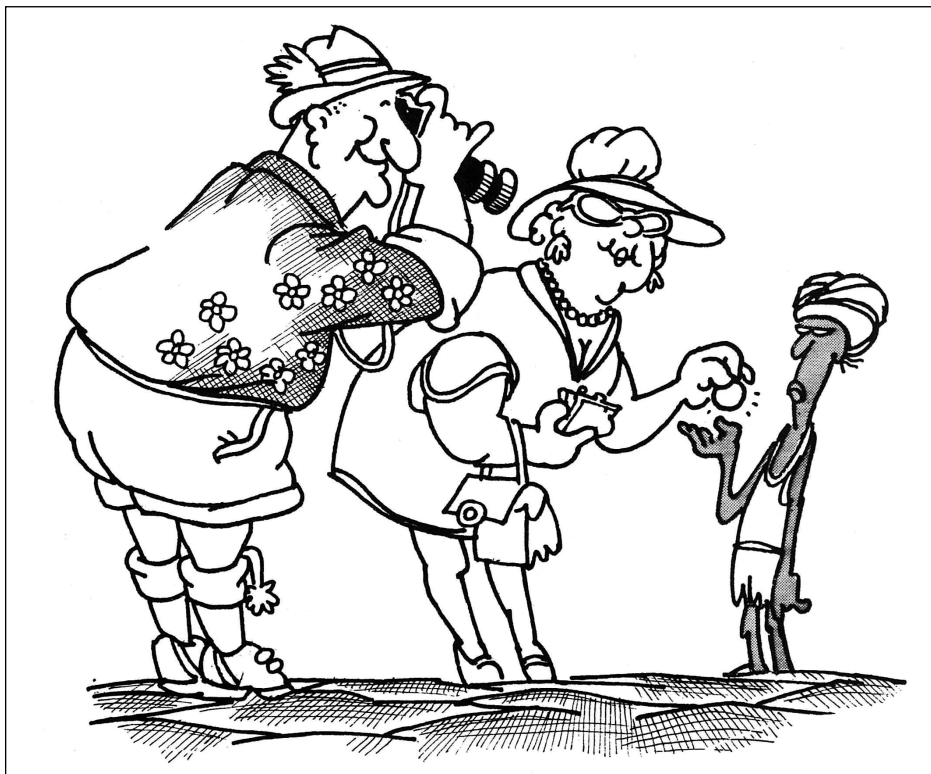
Touristes-rois en Afrique.

Tourisme équitable ou solidaire, la différence des vues frôle par moments la polémique ; or celle-ci n'a apparemment pas de raison d'être. Au-delà même de ces deux concepts, d'autres notions en tourisme militent pour la même cause, la bonne, bien entendu.