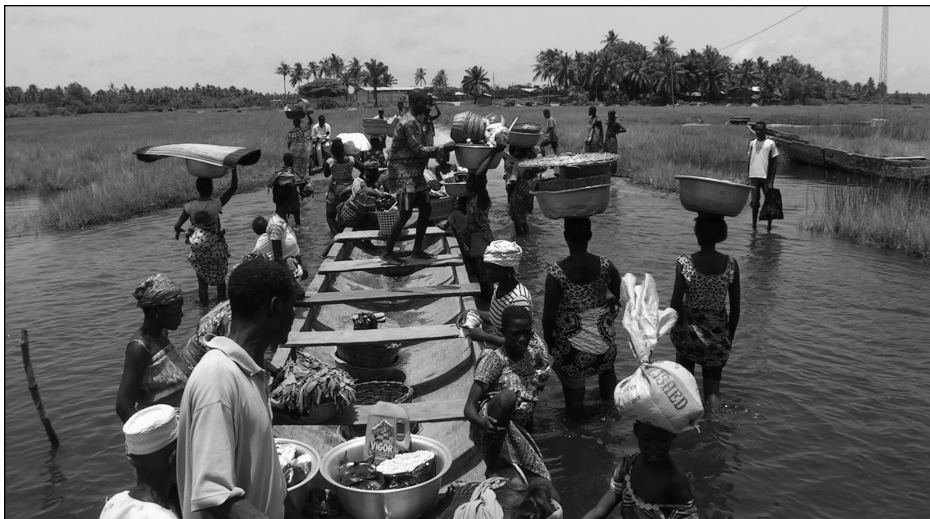
Village d'accueil TDS de Boala au Burkina-Faso.