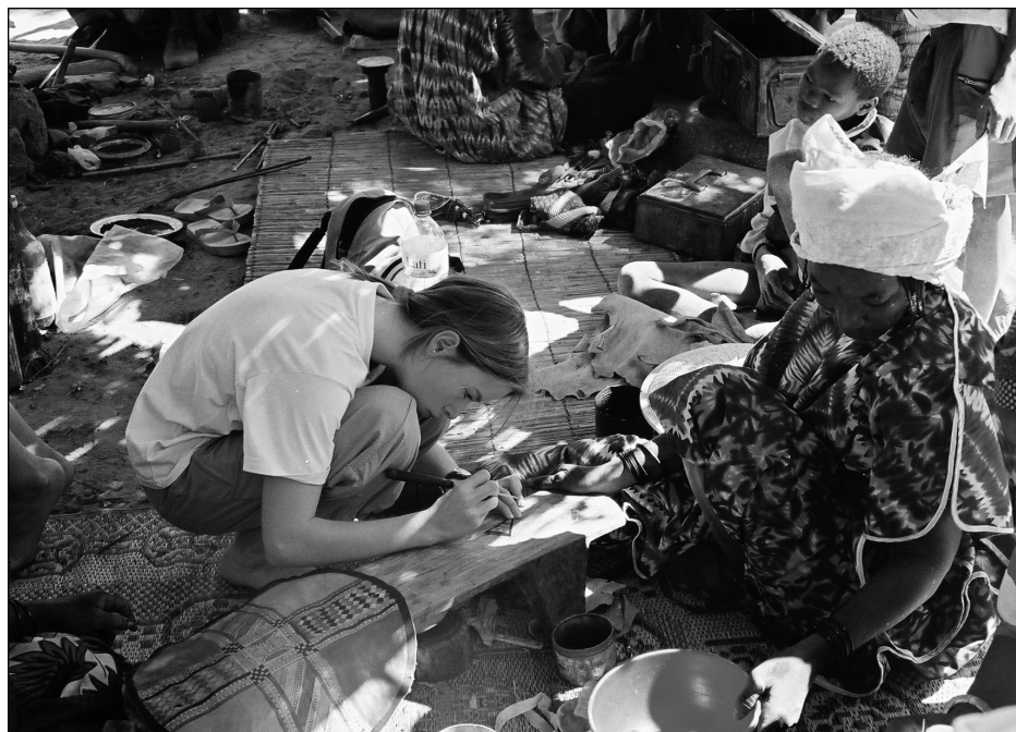
Village d'accueil TDS de Koirézéna au Burkina-Faso.