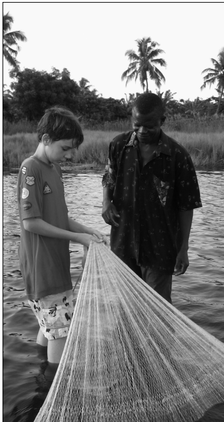
Village d'accueil TDS d'Avlékété au Bénin. Initiation à la pêche.

Et, surtout, que la moindre parcelle de temps soit remplie d'utilité : il est primordial de ne jamais rester sans rien faire ! Tel Pierre, l'homme pressé de Paul Morand (1941), qui « gâche tout, l'amitié, l'amour, la paternité, par sa hâte fébrile à précipiter le temps », ou le lapin d'Alice au pays des merveilles, nous sommes tous et toujours en retard, à courir, sans savoir où nous allons, après un temps qui passe de plus en plus vite ; pas seulement parce que nous vieillissons, mais aussi parce que notre emploi du temps se remplit sans cesse, plus vite que nous ne pouvons agir, du fait d'un empilement de tâches dont la réalisation est sans cesse interrompue par d'autres tâches, nous obligeant à zapper sans cesse d'activité et à morceler notre journée en une multitude d'instant sans consistance,