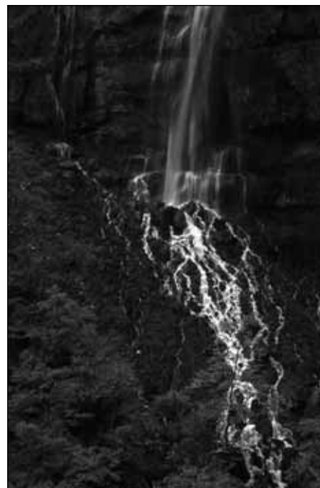
Cascade de Moulin Marqui, Parc naturel régional du Vercors.

Dans le Vercors, même si pour le moment les actions des uns et des autres ne sont pas coordonnées, la section locale du SNPSC est en train de réfléchir à la constitution d'une « commission équipement » qui déciderait, avec toutes les personnes concernées, des actions à mener dans ce domaine. On peut donc constater que la section locale du SNPSC souhaite s'investir dans l'équipement, comme elle le fait déjà dans la défense de l'accès au site. Si elle agit ainsi, c'est que l'enjeu pour elle est de garder le contrô-