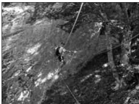
La via Ferrata de Nant de Rossane à Aillon le Jeune, Parc naturel régional des Bauges.