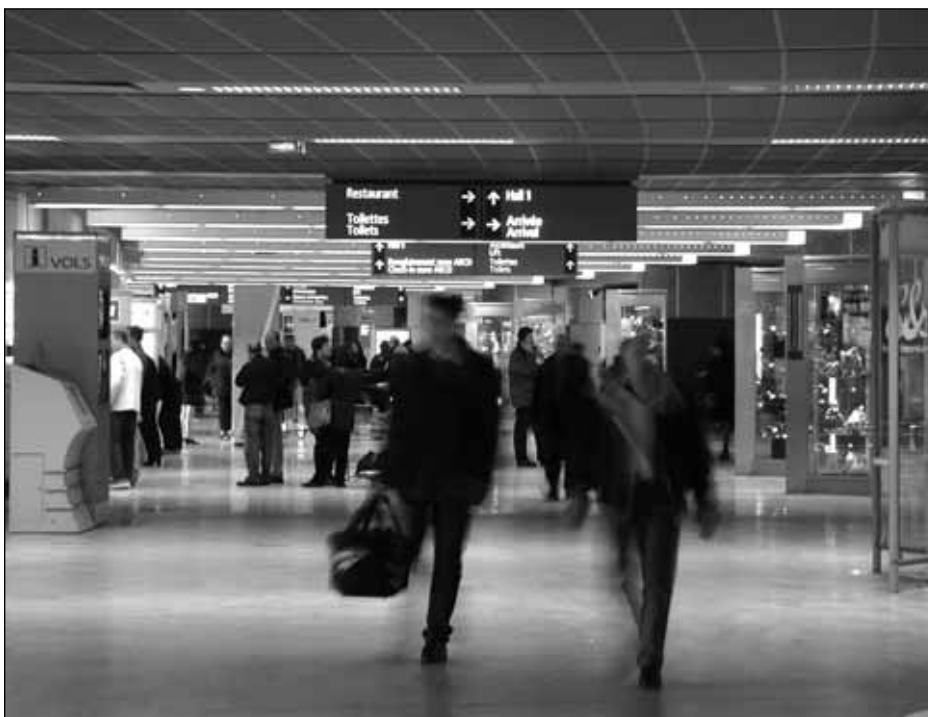
Aérogare de l'aéroport de Toulouse, France.

On estime qu'environ 1845 cas d'HA sont diagnostiqués au Canada chaque année et que près du tiers de ces infections auraient été contractées lors d'un voyage à l'étranger (Teitelbaum, 2004). L'HA est une maladie du foie causée par un virus qui se transmet au contact d'eau ou d'aliments contaminés par des excréments humains ou encore au contact de personnes infectées par le virus ; environ 70 % des personnes infectées par le virus de l'HA présenteront des symptômes qui apparaîtront, en moyenne,