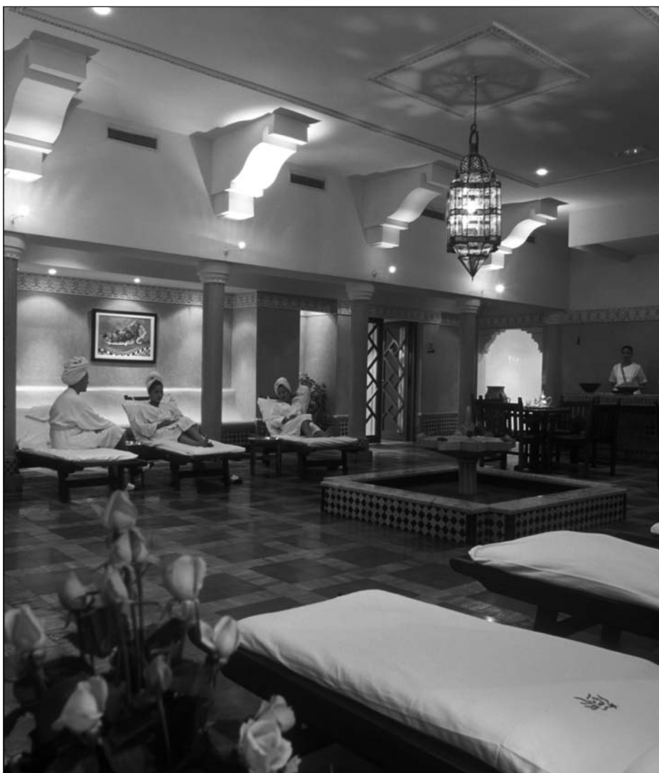
Thalassothérapie, Tikida Beach Agadir (Maroc).

La demande touristique doit être appréciée d'après les critères de l'Organisation mondiale du tourisme (OMT) ainsi qu'en fonction de la nature de la clientèle touristique. C'est ainsi qu'il convient de distinguer les touristes marocains qui viennent en vacances pendant la saison d'été et qui résident principalement dans leur famille des autres catégories de visiteurs. En effet, la définition du touriste de l'OMT qui a été adoptée par les Nations unies s'appuie essentiellement sur la durée du