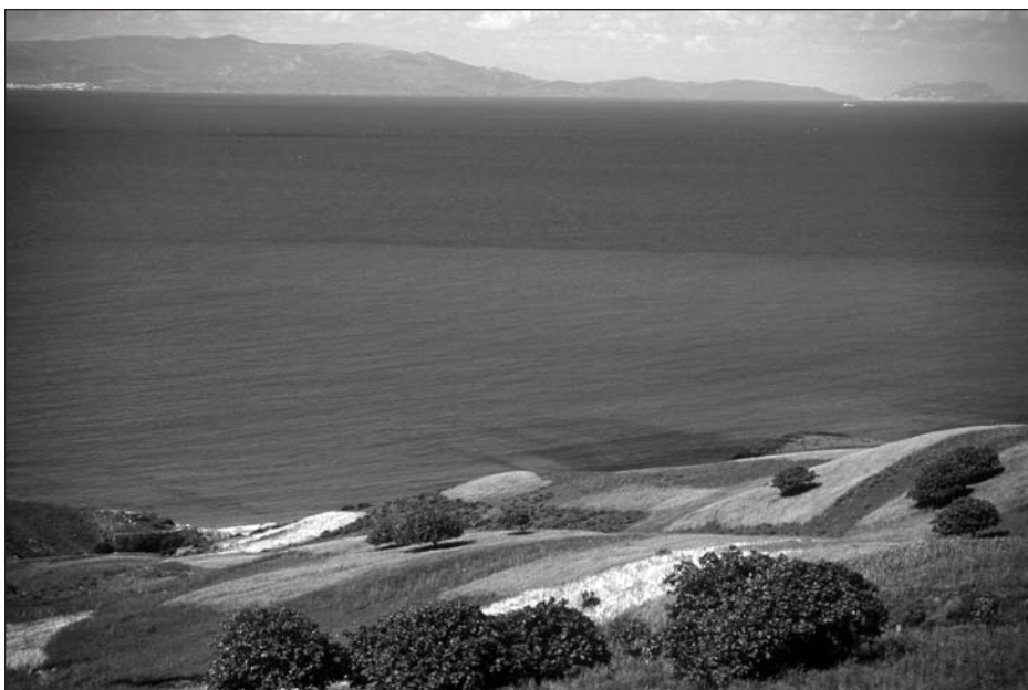
L'Espagne, vue de Tanger (Maroc).

Créé en 1986, le groupe ATLAS, filiale de la compagnie Royal Air Maroc, constitue un autre des plus importants opérateurs hôteliers. Il projette un hôtel de 100 chambres à Essaouira et un autre à proximité de l'aéroport de Casablanca-Nouasseur.