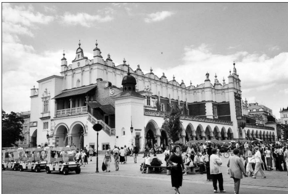
Marché couvert de Cracovie, Pologne.

S'il donnait bonne conscience à plusieurs, le virage qualité pris par l'industrie touristique ne satisfera pas les critiques des excès de cette industrie, loin s'en faut. En particulier, il devenait évident, du tournant des années 1970 aux années 1980, que les répercussions des activités touristiques sur les milieux récepteurs causaient des dommages sévères et parfois irréversibles, des dommages que les retombées, notamment économiques, ne pouvaient compenser. Le phénomène avait déjà été constaté dans le cas des grandes stations de mer et de montagne dont les aménagements avaient bouleversé des environnements fragiles et souvent maintenus à l'écart du développement, jusqu'à leur découverte par des promoteurs et des professionnels du tourisme. Mais, peu à peu, un constat similaire serait fait dans le cas des villes assaillies par les visiteurs de plus en plus nombreux. Bien qu'en apparence moins fragiles que les environnements naturels ou accessoirement humanisés, plusieurs des villes considérées comme des foyers d'art et de culture subissent en effet « une pression touristique considérée, à certaines périodes de pointe, comme insupportable, au-delà de la 'capacité de charge' maximale : Florence et Venise, Grenade, Athènes, Évora, Bruges, Amsterdam, Salsbourg, Prague, Bath... » (Cazes et Lanquar, 2000 : 115).