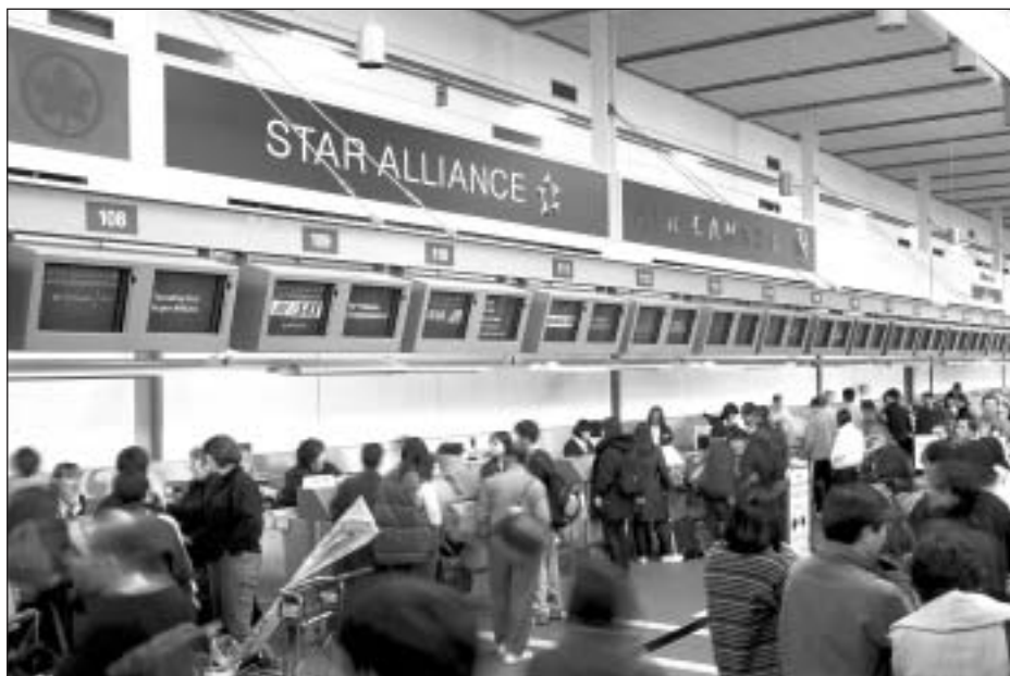
L'enregistrement à l'aéroport international Pierre E. Trudeau de Montréal.

Devant cette crise, le gouvernement des États-Unis a décidé d'accorder une aide aux transporteurs aériens américains, ce qui a provoqué une réaction en chaîne ailleurs