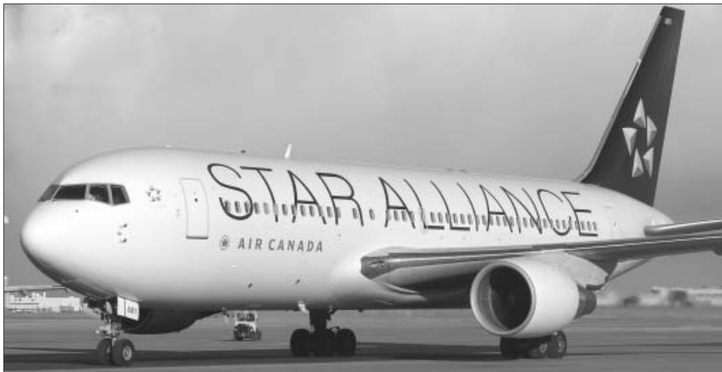
Un Boeing 767.

re de coût beaucoup plus faible comme en fait foi la figure 1. En Europe, des transporteurs à tarifs réduits comme EasyJet, Ryanair et Virgin Express voient le jour. Bien qu'ils ne connaissent pas tous le même succès que Southwest, ils occupent une part grandissante du marché. Au Canada, c'est surtout WestJet qui occupe ce segment du marché intérieur, mais de nouveaux transporteurs comme Jetsgo et Canjet se sont ajoutés en 2002. Dans l'ensemble du Canada, la part de marché des transporteurs à tarifs réduits (mesurée en sièges-kilomètres) est passée de 16 % en 2000 à 36 % en 2002 et on prévoit qu'elle franchira le cap des 50 % en 2004 (Ward, 2002 : 93).