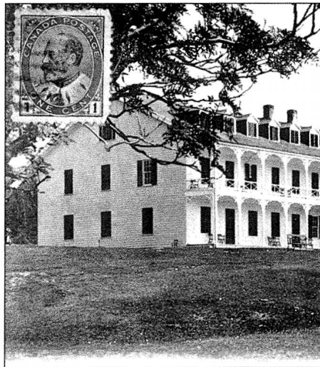
L'hôtel Tadoussac, commercialisé par plusieurs cartes postales dès le début de XX e siècle.

Cette station de villégiature, organisée par la compagnie de navigation du Richelieu, devient le point de départ des excursions sur le Saguenay. Au XIX e siècle, un tel