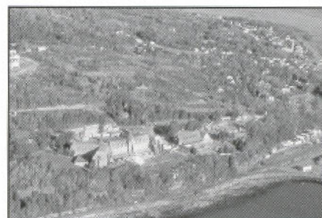
Le Manoir Richelieu, en voie d'agrandissement

Dans nos sociétés cassées en deux, le tourisme de distinction se porte mieux que jamais. Les gagnants de la nouvelle économie mondiale ont une liberté de mouvement sans précédent. Patrimoine et environnement occupent une place de choix dans les stratégies territoriales mises en œuvre par ses acteurs. Et on peut anticiper que l'un et l'autre contribueront encore longtemps à distinguer les positions haut de gamme. Ils répondent de valeurs profondes. Patrimoine et environnement