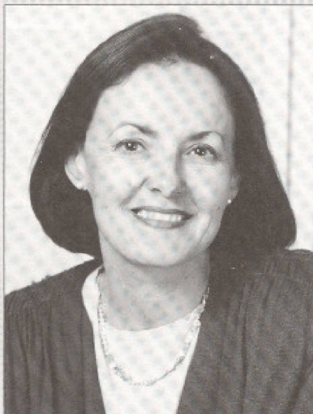
Madame Rita Dionne-Marsolais, ministre déléguée au Tourisme et responsable de la Régie des installations olympiques.

Selon une étude effectuée par la CET sur l'évolution du marché émetteur des États-Unis, l'un des plus importants, la raison la plus fréquemment citée pour ne pas avoir visité l'Europe en 1992-1993, est le coût du voyage et encore plus souvent, celui de l'hébergement. C'est ce qui explique certaines tendances déjà observées: la préférence croissante pour des voyages plus courts (moins de deux semaines), une certaine propension à voyager volontiers en saison creuse, un délaissement de la première classe dans les transports aériens, un déplacement des touristes des classes moyennes vers des modes d'hébergement plus modestes (la formule Bed and Breakfast est de plus en plus populaire) et une tendance à réserver de plus en plus tardivement afin de pouvoir bénéficier des tarifs spéciaux de dernière heure.