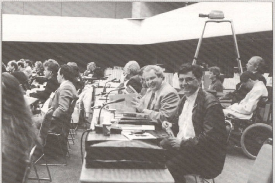
Dans l'ensemble, les participants ont suivi avec beaucoup d'attention les présentations des conférenciers. Toutefois, certains n'ont pas ignoré la présence du photographe dans la salle...

On peut donc affirmer que l'industrie des GDS inclut un joueur européen, AMADEUS. Mais que lui réserve l'avenir? En 1993, une entente de coopération avec les GDS américains et asiatiques devrait être conclue. Il tente également de finaliser une entente avec les compagnies ferroviaires SNCF et Deutsche Bundesbahn. Et finalement, il va continuer à intéresser de nouveaux fournisseurs tels que des tours opérateurs, des traversiers et d'autres produits touristiques.