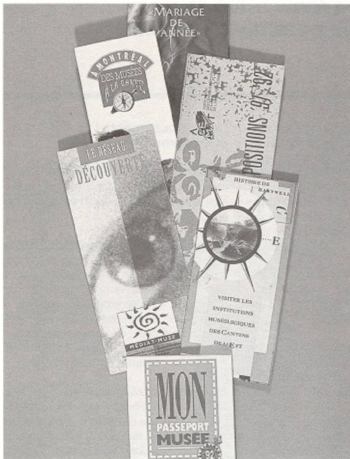
Les musées québécois ont réalisé ces brochures au cours de la dernière année : elles témoignent d'un engagement dans la diffusion auprès d'une clientèle touristique à exploiter.