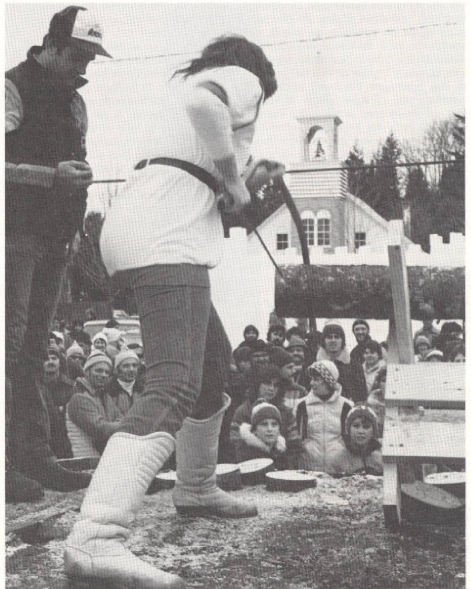
«Dans un immense pays comme le nôtre, les diversités régionales sont plus que dans bien d'autres cas sources d'originalité et de créativité». Les festivals en sont le témoignage.

Le gouvernement fédéral se centre beaucoup plus sur les événements de la culture nationale qui soulignent l'unité, l'union des peuples alors que les Québécois sont axés sur la culture régionale. Le gouvernement d'Ottawa dispose de moyens techniques plus importants, ce qui lui permet d'assurer une permanence aux équipements. Ses réalisations ont l'air plus compétentes, plus professionnelles, mais