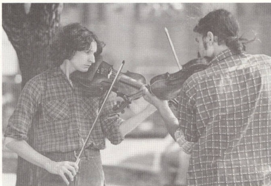
Comment présente-t-on les Québécois?

Mais le Québécois privilégie toujours la culture vécue par rapport à la culture organisée. Les grandes productions, les grandes salles le laissent indifférent; il préfère les festivals, les fêtes, les manifestations populaires. «// y a toujours,