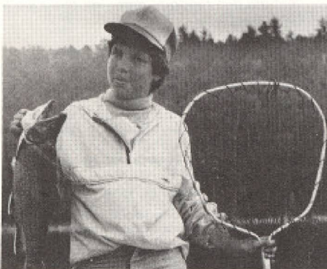
«C'est la certitude d'avoir du gibier qui attire...»