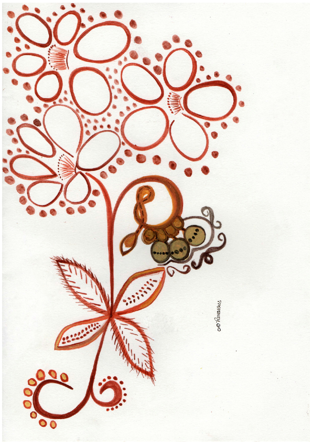
Figura 1: Tecnologia Arouak, Renata Inahuazo, 2021, Giz oleoso em papel A3