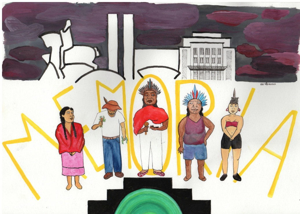
Figura 10: Continuidade, Renata Inahuazo, 2021, Aquarela e caneta ink em papel A3