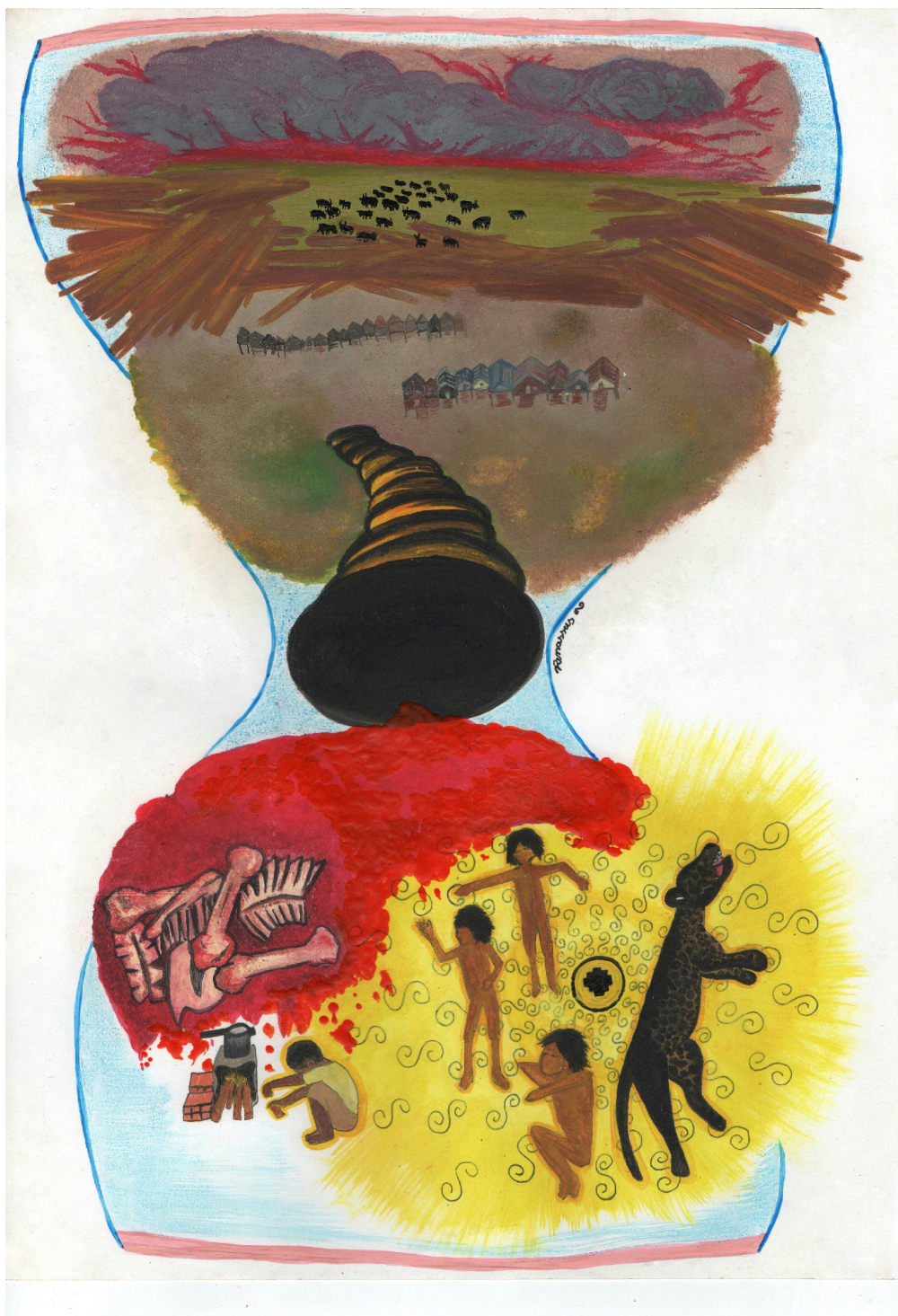
Figura 13: Quando tempo é dinheiro, 33 Renata Inahuazo, 2021, Giz oleoso e tinta de tecido em papel A3