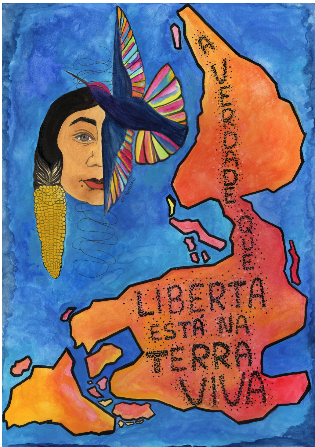
Figura 11: Terra viva, Renata Inahyzo, 2021, Aquarela, caneta nankin e tinta de tecido em papel A3