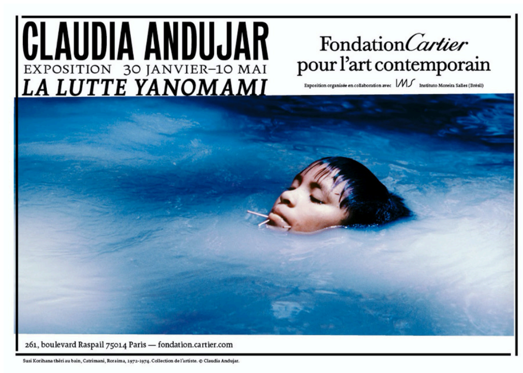
Figura 8: Cartaz da exposição La lutte Yanomami , ocorrida na Fondation Cartier, em Paris, entre 30/01 e 10/05/2020; reabertura de 16/06 a 13/09/2020

A exposição de Andujar aguçou ainda mais o desejo de empreender a leitura do instigante livro escrito por Davi Kopenawa e o antropólogo francês Bruce Albert, La chute du ciel. Paroles d'un chaman yanomami [A queda do céu. Palavras de um xamã Yanomami], nascido dos relatos de Kopenawa ao etnólogo, em sua língua materna, traçando sua trajetória pessoal, desde a descoberta de sua vocação para xamã ainda na infância, até o avanço devastador do homem branco pela floresta, assim como sua luta e suas viagens ao exterior, na tentativa de denunciar a barbárie e defender seu povo.