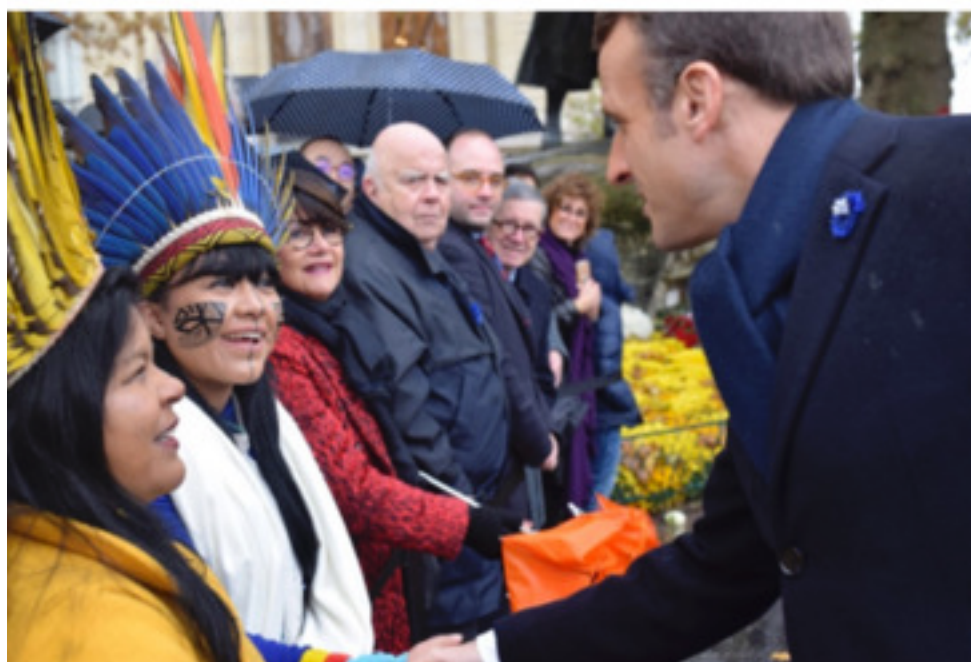
Figura 6: Ao alto, a prefeita de Paris, Anne Hidalgo, cumprimenta Sônia Guajajara; acima, o presidente francês Emmanuel Macron em aperto de mão com Célia Xakriabá.