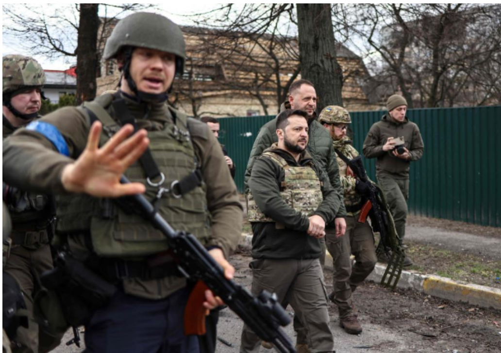
FIGURE 1 – Volodymyr Zelensky visite Boutcha dévastée, à la veille de son intervention aux Nations-Unies. Le président ukrainien est sur tous les fronts depuis le 24 février 2022, son énergie a transcendé une situation impossible pour résister à l’invasion russe, renforcer l’appui militaire américain et européen, et galvaniser tant les corps d’armée que les secouristes et une population en état de choc.

Acté. Un mois après l’invasion barbare de l’armée russe en Ukraine, le décompte macabre dépasse probablement les 20 000 soldats tués (pertes cumulées des deux armées), et combien de blessés ? 100 000 ? Combien de morts parmi les civils ? Plus de 300 victimes dans le bombardement criminel du théâtre de Marioupol, ville martyre ayant résisté en 2014 au premier assaut russe et survécu huit ans à proximité de la ligne de front restée une zone militaire dangereuse. Vidée de sa population dont une part a péri sous les coups d’une armée qui détruit à distance les villes et les vies : la mairie de