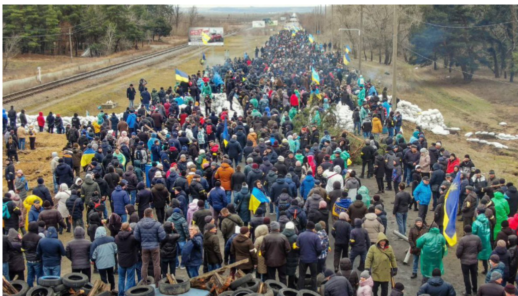
FIGURE 14 – À l’arrivée des troupes russes dans la ville d’Energodar, siège de la plus importante centrale nucléaire européenne, les habitants font montre de leur détermination patriotique. Le 3 mars, Dimitry Kuleba, ministre ukrainien des affaires étrangères, a publié cette photo pour affirmer que son pays sortirait vainqueur de cette confrontation.

Changeons d’espace : au moment de l’invasion japonaise de la République de Chine, du confinement des opposants tokyoïtes résulta un long silence aux effets durables sur le Japon de l’après-guerre. Auteur primé par l’Académie française, Akira Mizubayashi (2019) a fait de l’opposition impuissante des intellectuels condamnés à la solitude, ayant dû choisir entre l’exil intérieur et l’émigration, la trame de son magnifique roman Âme Brisée . 150 ans après l’appel de Hugo, près d’un siècle après la victoire des militaires japonais, ni la Pologne ni la Chine ne se sont remises des invasions qu’elles ont subies. Souvenons-nous de Katyn, méditons sur les millions de victimes du communisme chinois dont l’invasion japonaise a dialectiquement préparé l’ascension. L’Ukraine pourra-t-elle surmonter le traumatisme de cette guerre barbare ? Dans cent ans, la Russie aura-t-elle purgé son passif historique ? Sur l’exemple allemand, nous savons que cela exige des Russes qu’ils réécrivent en totalité leur histoire politique : ayant prétendu placer le peuple au centre du pouvoir, les Soviétiques ont massacré les paysans autant qu’ils ont vaincu Hitler. Avide de