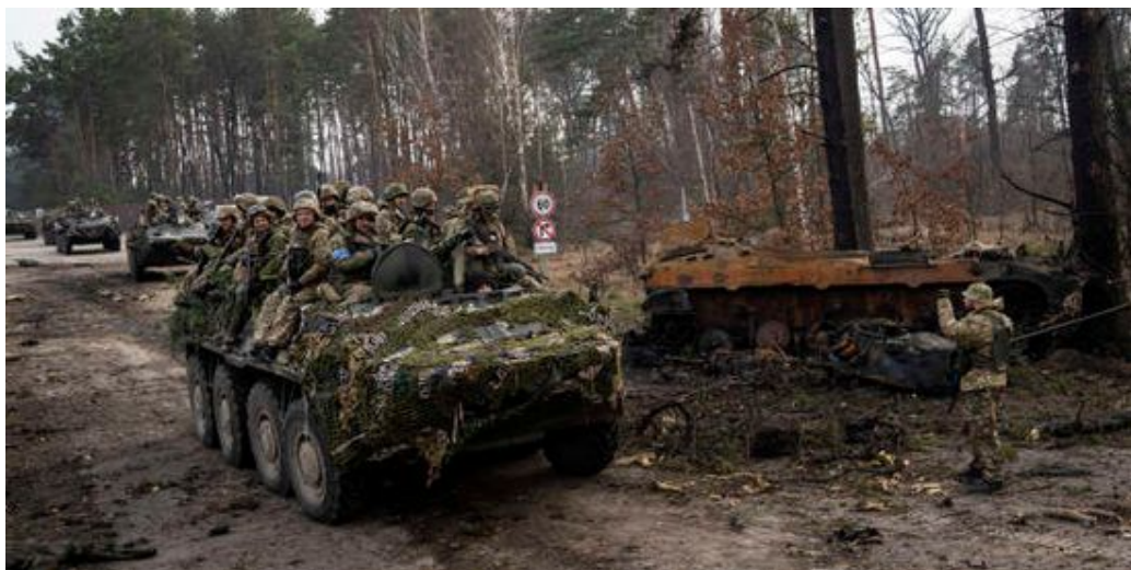
FIGURE 2 – Dans les environs de Kiev, fin mars, soldats ukrainiens et chars russes détruits.