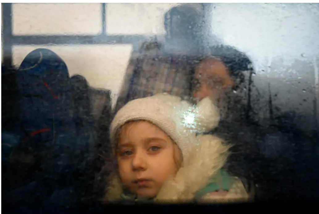
FIGURE 15 – Une fillette dans un bus évacuant des réfugiés ukrainiens vers la Moldavie une semaine après le début du conflit.

le présent. Chaque époque a ses propres stéréotypes, et Dostoïevski parle de la guerre en étant presque émerveillé de celle-ci, vue comme une fête pour un peuple qui a la possibilité de montrer son accomplissement ». La vérité viendra des exilés, leurs émotions sont plus proches du drame.