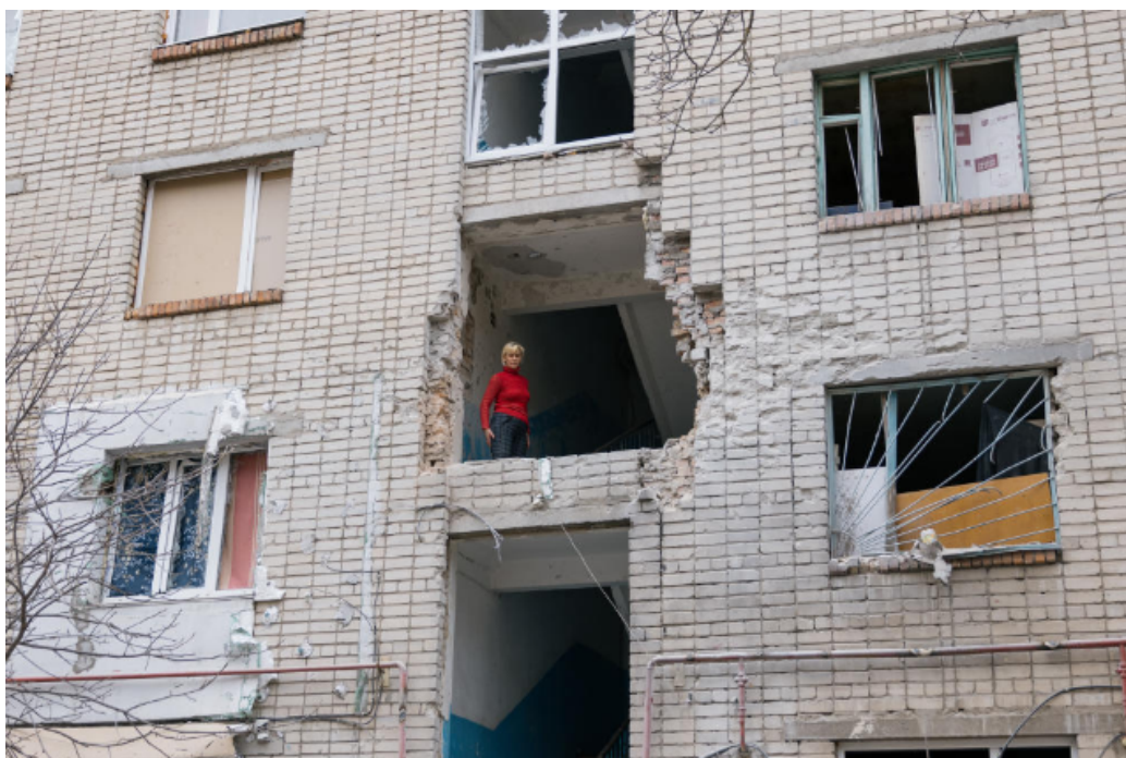
FIGURE 3 – La stupéfaction est mondiale quand circulent les premières photos de la destruction systématique des villes ukrainiennes. Ici Mikolaiev.

En dépit de ses attentes stratégiques, Poutine s'aveugla probablement en raison de cette dialectique de la violence. Réduire à néant les Ukrainiens, coupables en 2014 d'avoir rejeté le président qu'il contrôlait et de consolider leur État depuis, c'était faire justice d'un affront. Quand Sartre (1983, 187) écrit : « la violence est confiance dans le pire », on croit lire un jugement sur la décision de Poutine. Entrant en Ukraine, Poutine fait voler en éclats 75 ans de multilatéralisme, détruit l'ONU dans sa mission principale et rend le monde à venir infiniment plus violent. Les guerres et l'occupation de territoires sont génératrices de culpabilités en tout genre et de traumatismes ineffaçables (Aubenas 2022). Comment appréhender ce passage à l'acte chez un chef d'État qui avait jusqu'alors mis à profit des situations litigieuses plus qu'il ne les avait créées lui-même ? C'est d'ailleurs peut-être encore le cas, selon Bruno Tertrais (2022) : « La grande erreur des Occidentaux est de n'avoir pas trouvé, depuis 2014 ou avant, les moyens de signifier à la Rus-