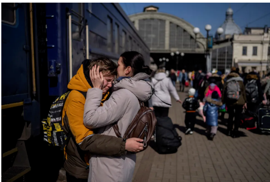
FIGURE 12 – Fin mars 2022, gare centrale de Lviv, Ukraine. Une mère accueille son fils réchappé du siège de Marioupol à sa descente du train. En avril, le photographe Sergei Supinski est à Borodianka, où des immeubles d'habitation et des pavillons ont été pris pour cible. Le maire évoque la mort de 200 civils

dans les attitudes russes et la préparation du conflit une réponse aux menaces de l'OTAN, puisque personne n'aurait voulu discuter franchement des conditions de Poutine pour éviter le conflit ? De ceux qui qualifient maintenant la défense acharnée de son territoire par l'Ukraine de preuve que ce pays est entièrement contrôlé depuis l'étranger ? Ces thèses permettent à Poutine de déclarer que son armée capture des nazis. Ce délire en appelle aux passions et ne se laisse pas raisonner. Ce qui se présente comme des convictions idéologiques tient donc en grande partie à des affects déterminant les comportements ; si nous éprouvons de la honte, rien n'empêchera la conviction du financier de pouvoir agir rapidement pour inverser les flux de capitaux, ni celle des « non-alignés » de passer sous silence le drame ukrainien au profit d'une lutte prioritaire contre l'impérialisme des anciennes puissances coloniales et des États-Unis.