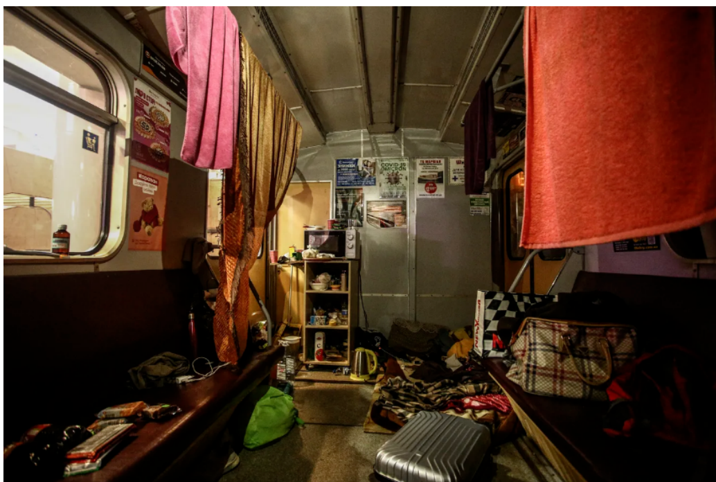
FIGURE 10

Plus affectée encore par cette attaque injustifiable, la mouvance idéologique de la gauche anti-impérialiste ne s'en relèvera pas. Si certains crurent qu'elle survivrait à la guerre froide, elle perd tout espoir de voir un gouvernement légitime s'opposer à l'ordre libéral : Noam Chomsky donne par avance un quitus à Biden et Zelensky.