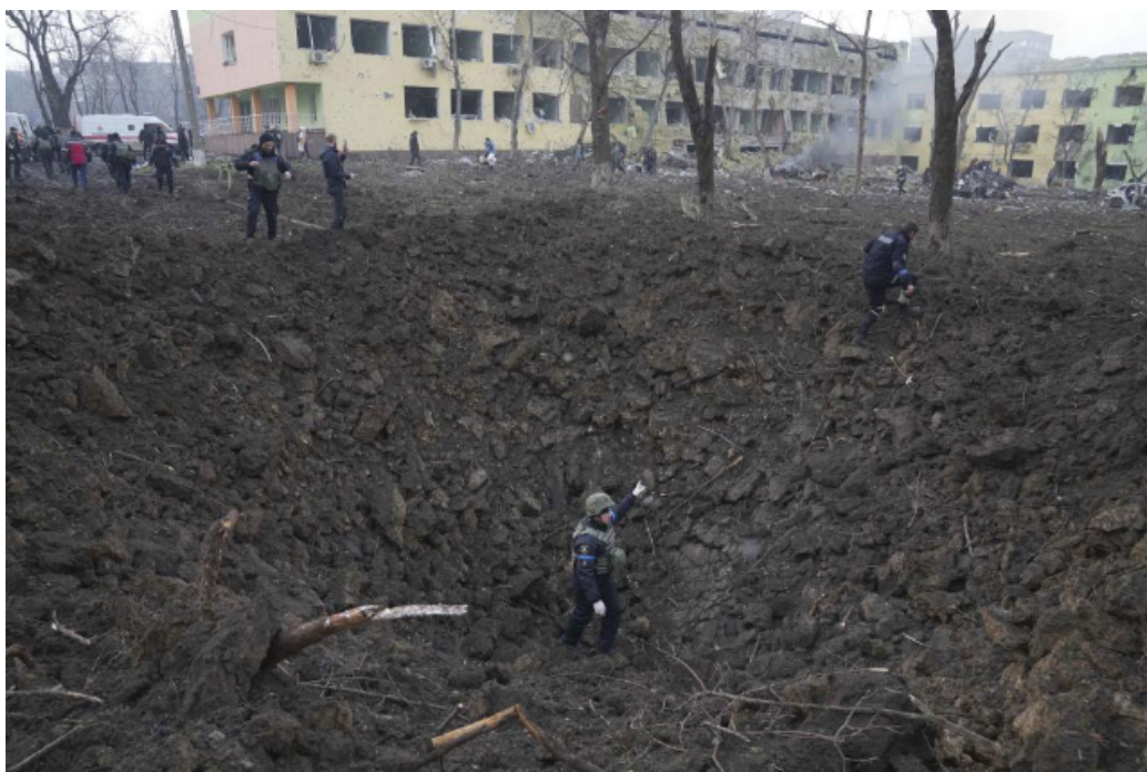
FIGURE 13 – Impact de bombe dans l’hôpital de Marioupol.

Il est non seulement naïf, mais complice de prétendre que la grande culture russe du passé aiderait à lever l’opprobre que Poutine fait peser sur les Russes. C’est en s’opposant qu’on soutient la langue, non par des platitudes. Les journalistes du site MEDUZA, par exemple, ont une activité exceptionnelle, mais le site, installé en Lituanie et dont la sécurité a été renforcée par Reporters sans frontières, n’atteint plus en Russie que ceux qui ont mis en place un cryptage de leur internet, et tous les médias indépendants locaux sont réduits au silence.