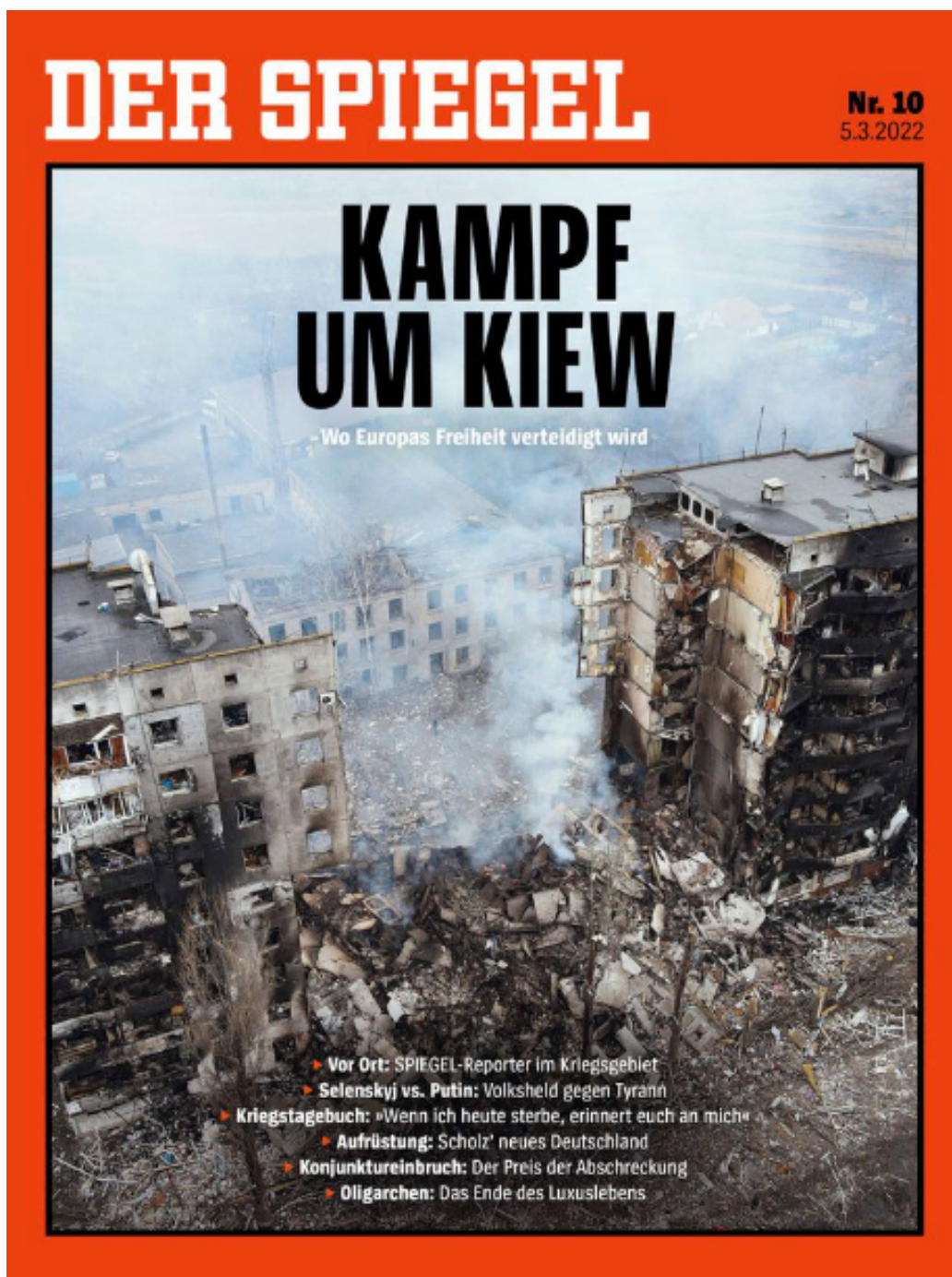
FIGURE 17 – Un grand hebdomadaire allemand publie en couverture une des dernières photos prises par Maks Levin, photographe ukrainien de renom, mort durant les combats près de Kiev. 54