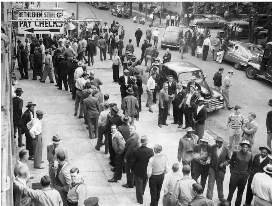
FIGURE 2 – Sparrows Point : Bethlehem Steel, une file d'attente pour recevoir sa paie, années cinquante

mutations actuellement les plus rapides. Si elle est passée de 10 à 40 millions d'habitants depuis 1950, San Francisco, qui avait 775 000 habitants à l'époque, en compte juste 100 000 de plus aujourd'hui. Son enrichissement se traduit toutefois par la diminution de 60 % du nombre des Afro-américains dans cette ville – passés de plus de 13 % de la population en 1970 à moins de 6 % aujourd'hui. Le marqueur ethnique reste le plus pertinent pour décrire l'occupation du territoire américain – cela vaudrait mutatis mutandis pour d'autres pays.