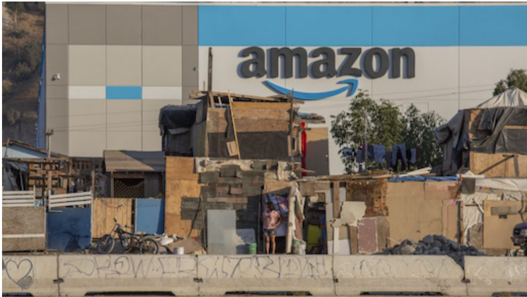
FIGURE 5 – Les accords entre le Mexique et les USA font de Tijuana un hub industriel en même temps que cette ville-frontière symbolise l'écart de richesse avec San Diego, toute proche, devenue la 8 e ville américaine. Les photos d'Omar Martinez ont été abondamment relayées

tous les autres acteurs. Rien ne devrait altérer le rythme de la concentration des fortunes sur des territoires particulièrement étroits, devenus inaccessibles au commun des mortels. Le risque majeur des décennies à venir est donc le décrochage de la grande masse de la population qui n'aura d'autre perspective que de quémander des emplois mal payés auprès des entreprises de logistique, d'emballage ou de catalogage. Ces emplois subalternes ont éclipsé les fonctions techniques qualifiées de la classe ouvrière d'autrefois. Ils seront eux-mêmes remplacés par des robots qui formeront la plus impitoyable armée de réserve du capitalisme.