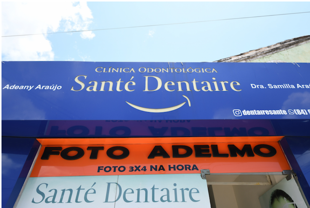
FIGURE 1 – Logo « Amazon » Dentaire

La ressource humaine est bien le facteur déterminant de la richesse des entreprises, et l'espace-temps néolibéral est un incessant mouvement d'entraînement qui interdit le repos. Le cadre économique général sur lequel est venu se greffer la société des réseaux a pour soubassement une impitoyable sélectivité territoriale et sociale. Seules les régions disposant d'importants leviers de transformation bénéficient des investissements nécessaires à leur développement. Est-ce le sens qu'on peut prêter à la phrase de Jeff Bezos prononcée en 2018 à Berlin lors de la remise du Prix Axel Springer ?