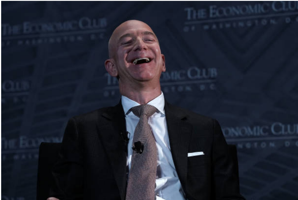
FIGURE 4 – Bezos à Washington

s'occuper plutôt de ses clients que de ses concurrents »... Banalités dignes du Dictionnaire des idées reçues . Jeff Bezos a-t-il un message à adresser aux gens ordinaires ? Il se présente comme l'homme du très long terme : est-ce à dire qu'il évite de se confronter aux problèmes de ses contemporains ? Les individus les plus influents savent traiter des données, non entendre les personnes. Faille majeure de notre temps. En dépit des placebos véhiculés par les réseaux sociaux, on voit venir l'obsolescence programmée des humains.