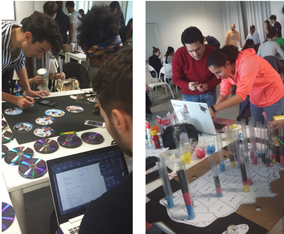
FIGURE 1 – Les matériaux recyclés utilisés par les étudiants : cd, papier, plastique cartons, sable coloré.

nelles. L'intérêt de ce mouvement est de regrouper des participants autour de contraintes créatives pour réaliser un court-métrage dans un temps limité (2 mois) en respectant un thème et une contrainte esthétique votés par le public. C'est en particulier la devise « Faites bien avec rien, faites mieux avec peu, faites-le maintenant ! » qui a nourri la conception du scénario pédagogique, avec l'idée de s'appuyer sur les compétences des étudiants pour choisir les matériaux les plus signifiants pour leur sujet et leur set de données, mais aussi les plus faciles à manier en un temps court (3h) et les moins coûteux. Cette expertise des matériaux est acquise depuis la première année de la Licence Design, avec des cours en basic design, technologies des matériaux notamment.