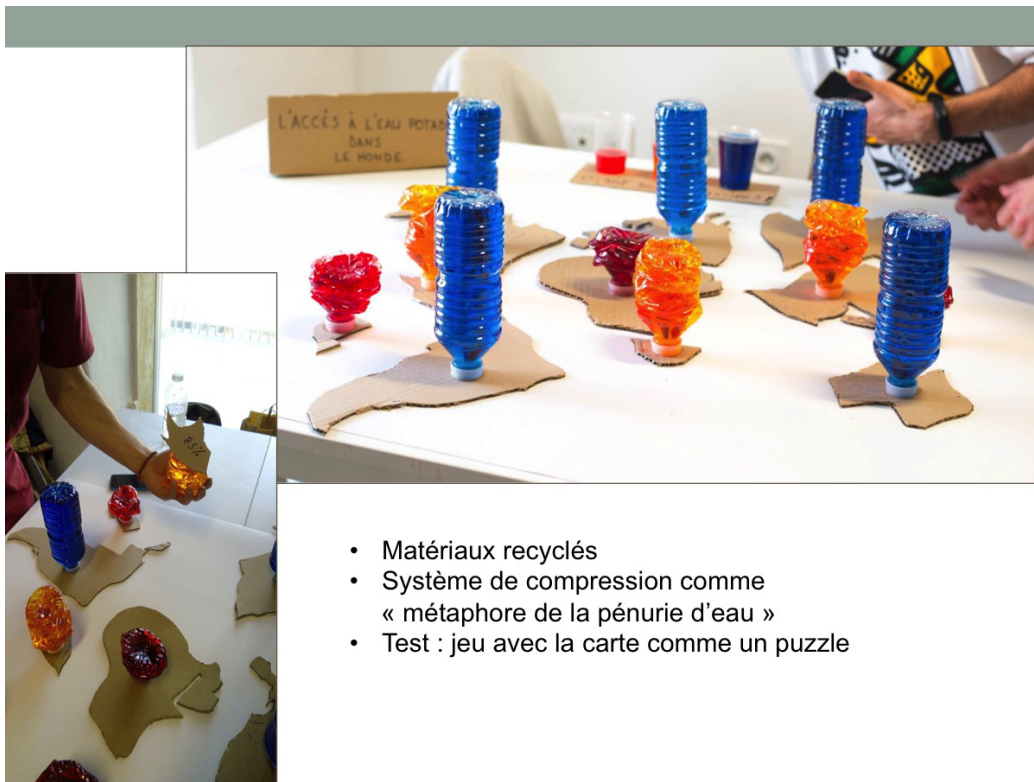
FIGURE 2 – L'accès à l'eau potable, réalisé par Lucas Bramas, Joris Chambat, Sylvain Colin, Damien Cousin.

continents détachables a été choisie pour favoriser la modularité et l'interaction avec l'utilisateur qui doit retourner le carton pour voir le chiffre. Les tests du dispositif par les autres étudiants ont révélé une dimension ludique qui n'était pas prévue a priori par les étudiants-concepteurs. Les étudiants-testeurs se sont pris au jeu de reconstituer la carte du monde comme un puzzle. Cette dimension ludique a été stimulée par la manipulation des formes en carton, la tangibilité du dispositif impliquant ainsi le corps de l'utilisateur pour comprendre les données.